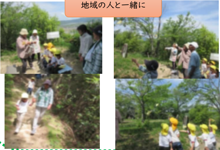
地域の人と一緒に

5歳児ひまわり組が地域の伊与部山に登りました。6名の地域の方が一緒に登ってくださり、準備して下さった宝探しのゲームでひらがなに触れたり、紙飛行機を飛ばす競争をしたりしました。頂上と園から互いに叫んだ『ヤッホー』が聞こえるかの実験をして、とてもはっきり聞こえることが分かり、驚いていました。3歳児も組は、お土産で持ち帰った紙飛行機を繰り返し飛ばして、よく飛ぶ紙飛行機の形や飛ばし方を発見していました。