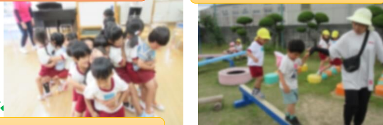
なかよし椅子取りゲーム