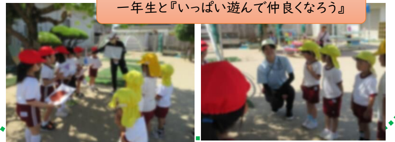
一年生と『いっぱい遊んで仲良くなるう』

第1回目の交流です。今年度は1年生も6人で、人数も同じです。この日の1年生の授業のめあては『いっぱいあそんでなかよくなるう』でした。初めに1年生、5歳児で自己紹介をしました。1年生の顔写真も掲示しているので名前と顔を知り、小学校や1年生を身近に感じる中で交流を重ねていきたいと思ひます。