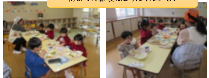
初めての給食はどうだったかな？

今日からもも組さんも給食が始まりました。ひまわり組さんと一緒に食べながら、最初は、同じ物を同じ場所で一緒に食べる楽しさや給食の準備の仕方、食べ方などを知ることがねらいにしています。まずは「楽しい雰囲気での食事」を大切にしていきたいと思ひます。