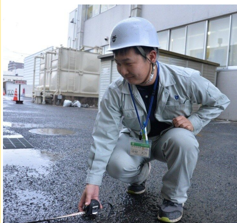
建設部地域応援課 (平成27年度採用)