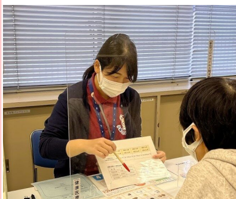
保健福祉部健康医療課 現:保健福祉部健康増進課 (平成31年度採用)

市民の健康づくり, 健診(検診), 予防接種業務 など 【配属先】保健福祉部 など