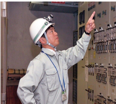
総務部財産管理課 (平成31年度採用)