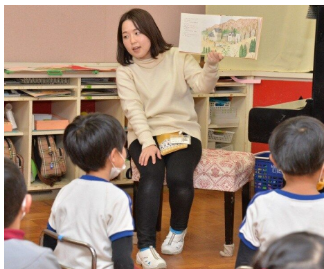
山手幼稚園 (令和2年度採用)