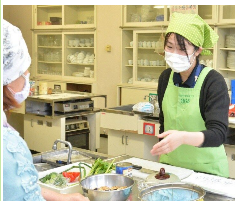
保健福祉部健康医療課 現:保健福祉部健康増進課 (平成31年度採用)

栄養相談, 栄養指導, 給食の栄養管理 など 【配属先】保健福祉部, 教育委員会 など