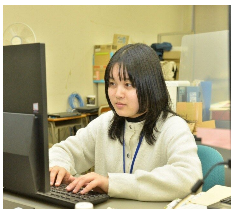
教育委員会教育総務課

8：30 始業 9：00 窓口・電話対応申請書類の確認 12：00 昼休み 13：00 窓口・電話対応申請書類の確認 18：30 勤務終了