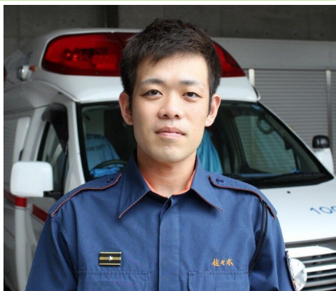
総社市消防署西出張所 (平成30年度採用)