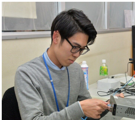
総合政策部市政情報課

戸籍・住民票・国民健康保険・福祉等の窓口業務をはじめ、政策、観光、都市計画、環境等の各施策の実施など市政全般 【配属先】全般