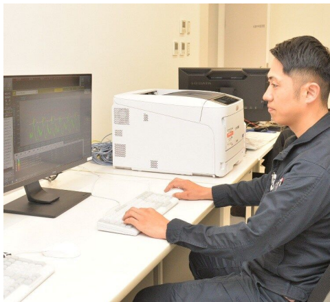
環境水道部上水道課 (令和3年度採用)

水道管の維持管理や修繕、新設・更新工事の計画と実施、漏水対応、工事時の断水や給水車手配、管路図や給水台帳の管理 など【配属先】上水道課