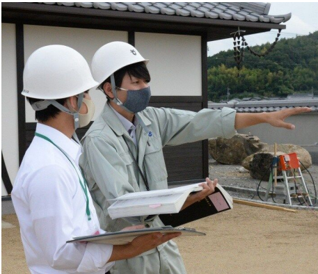
建設部建築住宅課 (平成29年度採用)