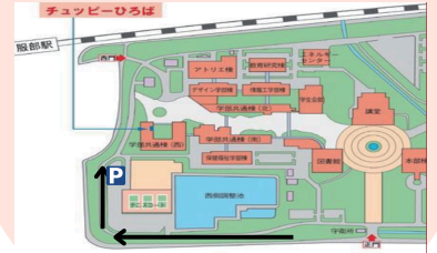
正門で駐車許可書をもらってください。