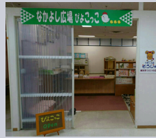
ぴよこっこの場所は天満屋ハピータウンリブ総社さんより無償で提供させていただいています。

総社市門田187 (天満屋ハピータウンリブ総社店内3階) 0866-31-7686