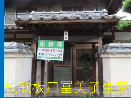
校歌板口富美子生家