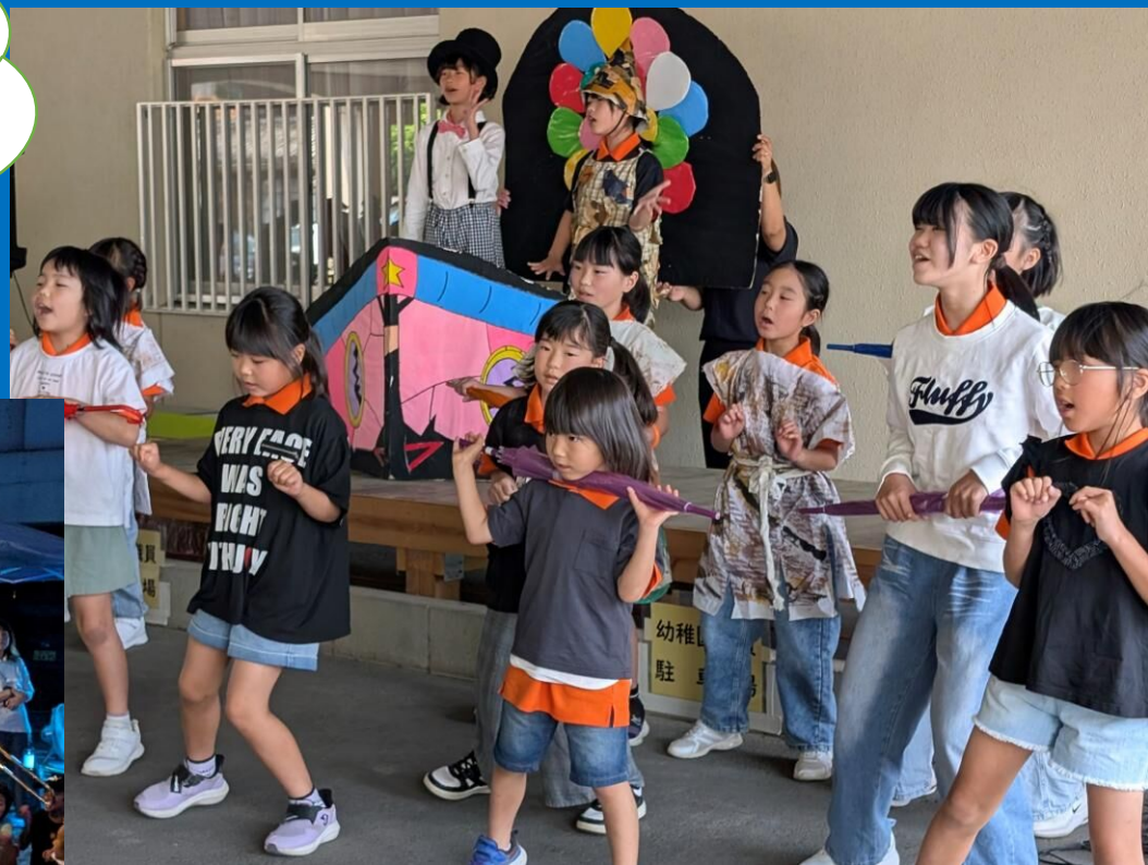
総社ジュニアコーラス