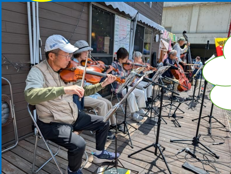
弦楽アンサンブル