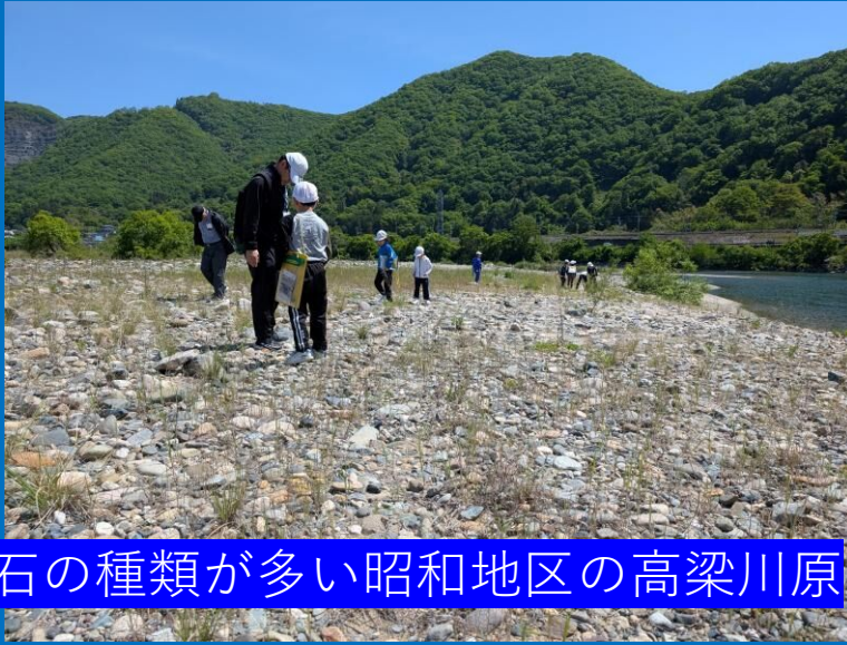
石の種類が多い昭和地区の高梁川原