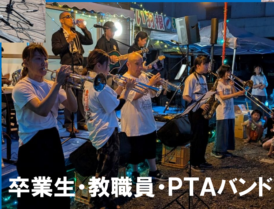
卒業生・教職員・PTAバンド