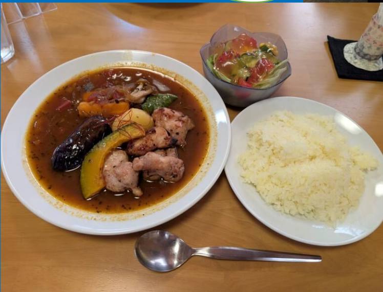
清心女子大学栄養学科学生 8.21スープカレーランチ