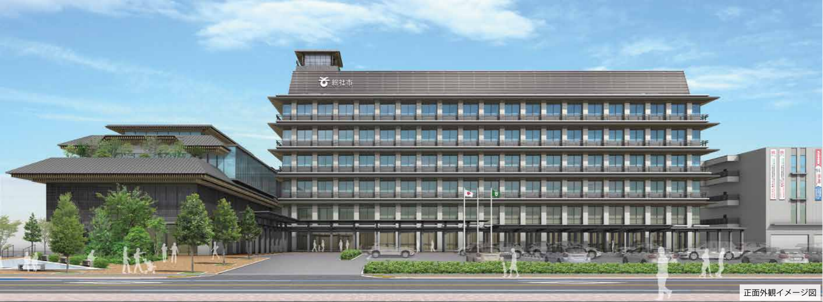
正面外観イメージ図