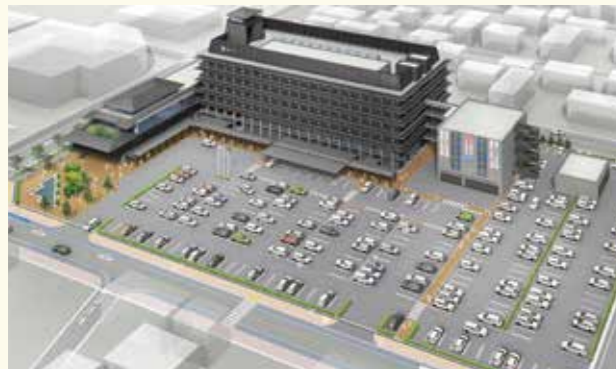
北側外観イメージ図

庁者駐車場は利便性を考慮し、新庁舎北側に配置。敷地西側は、公用車駐車場、倉庫棟、バス車庫で構成します。