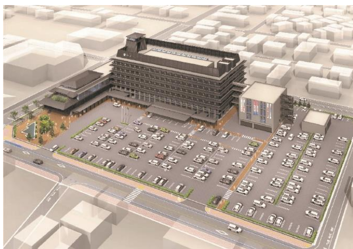
Tòa nhà nhìn từ hướng Bắc