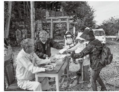
昨年スタンプラリーの様子

秦 歴史遺産保存協議会。秦地区に数多く残る歴史遺産や文化を保存・継承しようと、平成24年に発足しました。これまでの活動が認められ、10月に県文化財保護協会賞をいただきました。 活動の内容は、史跡の看板設置や紹介冊子の作成、小学校での出前授業などさまざまです。中でも、古墳や神社を巡る秦の郷スタンプリリーは平成26年にスタートし、市内外から約450人が参加する人気イベントになりました。 今年のスタンプラリーは新型コロナウイルス感染症の状況を踏まえ、期間中に各自で巡ってもらう形式に