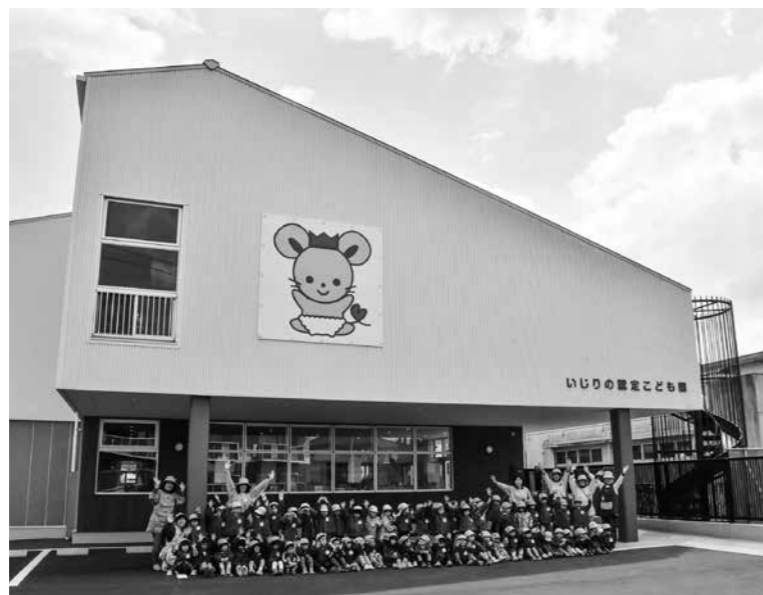
平成31年3月に完成した『いじりの認定こども園』