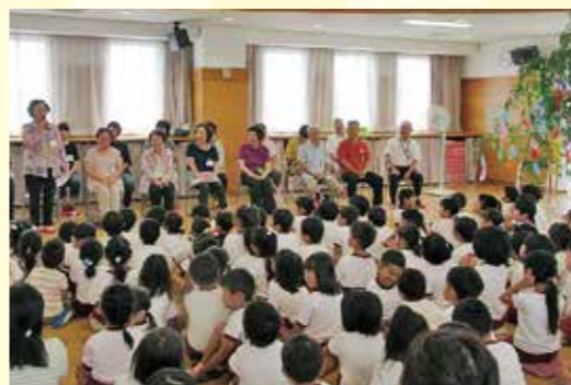
七夕会には地域の人に来て、七夕について教えてくれるんだ

園では「早寝・早起き・朝ごはん」を合言葉に、規則正しい生活リズムを身に付けることを目標にしています。園児は日々の生活の中で、健やかな心と体を育てています。