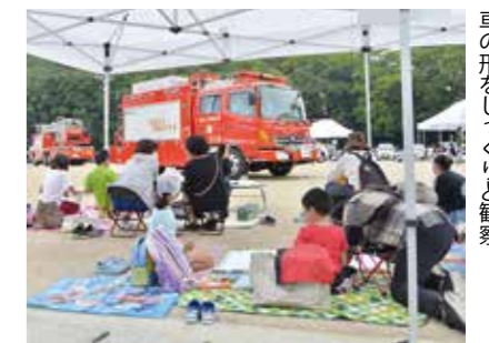
車の形をじっくりと観察

10月4日、市消防庁舎グラウンドで写生大会と消防フェスタを開催。小学生以下の子ども448人が来場しました。はしご車や救急車の絵を描いたほか、放水訓練や心肺蘇生法などの体験も行い、防火・防災意識を高めていました。