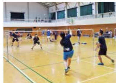
バドミントンでスマッシュ