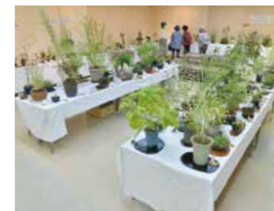
自然味あふれる山野草を眺める

10月2日から4日まで、総合文化センター市民ギャラリーで秋の山野草展が開かれました。今年で第30回となった同展。訪れた人は、市花の会会員が丹精込めて育てた山野草を熱心に鑑賞していました。