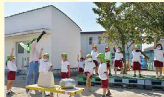
リズムダンスで決めポーズ。うまくできたかな