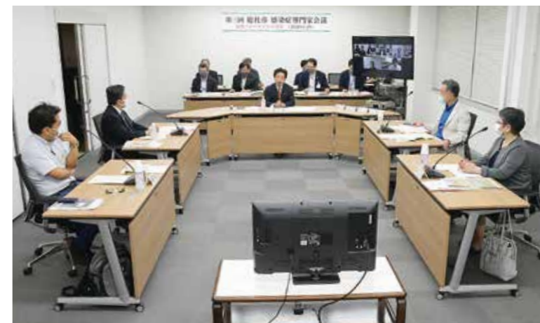
市長は、「会議での意見を踏まえ、対応を決めていく。総社市全体で感染症を予防していきたい」と述べた

会議では、8月に市内学校教職員の感染が判明した際、休校措置を取った経緯を説明。今後の感染者発生に伴う対応について、出席した医療関係者からは臨時休校に賛成の意見が多くあったほか、「休校ではなく学級閉鎖という選択肢もある」、「休校日数は、地域の感染者の増加状況を考慮して決定してはどうか」、「子どもには比較的风险の低い感染症であることを広く周知する必要がある」などの声も上がりました。