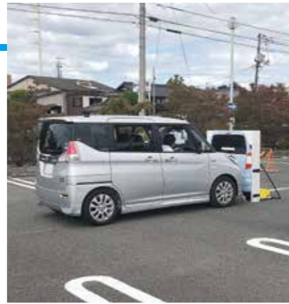
衝突の可能性が高い場合に、自動でブレーキを作動する衝突被害軽減ブレーキ

28日は市スポーツセンター駐車場で、衝突被害軽減ブレーキなどが搭載されたサポートカー体験会を実施しました。30日には、総合福祉センターで高齢者交通教室を開催。参加者は、運転技能や体力向上を目的に、ゲームや体操を行いました。