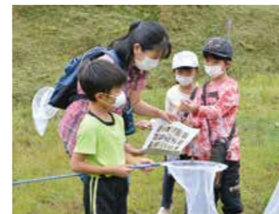
バッタの種類は何か

鬼城山ビジターセンター周辺で9月26日、自然観察会が行われました。親子連れ16人が参加し、虫捕り網を使ってバッタやコオロギを採集したり、じっくりと観察したりしながら豊かな自然に親しんでいました。