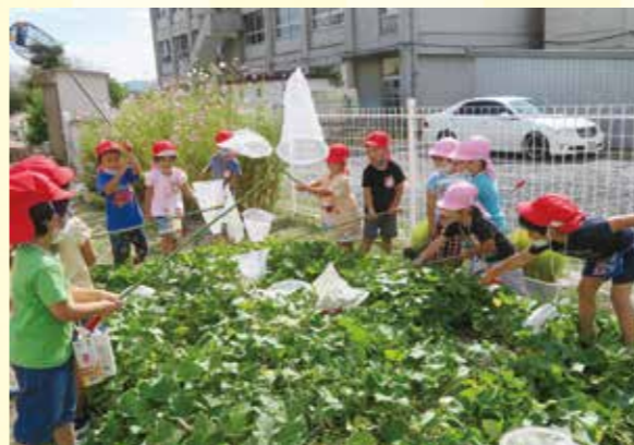
みんな一緒に園庭で虫捕り

市内南部、高梁川の東に位置する常盤幼稚園。園区内は住宅化が進み人口が増え、150人の園児が通っています。