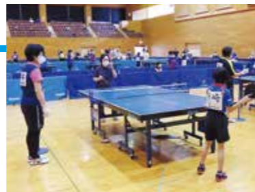
卓球では白熱のラリーを繰り広げた

10月11日、市スポーツセンターや総社北公園陸上競技場などで市民総合スポーツ祭が開催されました。軟式野球や卓球、太極拳、合気道、ゲートボール、ニュースポーツなど14種の競技を実施。約800人が参加し、それぞれの種目を楽しんでいました。