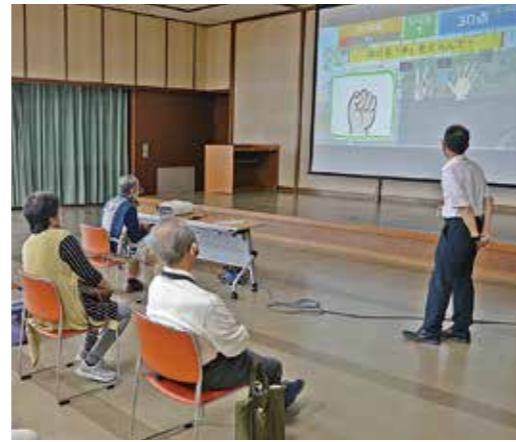
脳のトレーニングゲームで判断能力を鍛える