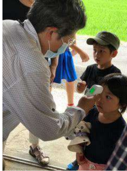
↑来場者は入り口で検温 ( forgot people are given masks )