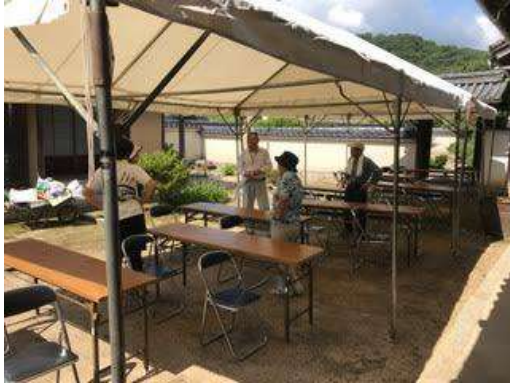
↑ソーシャルディスタンスを意識した観覧席作り