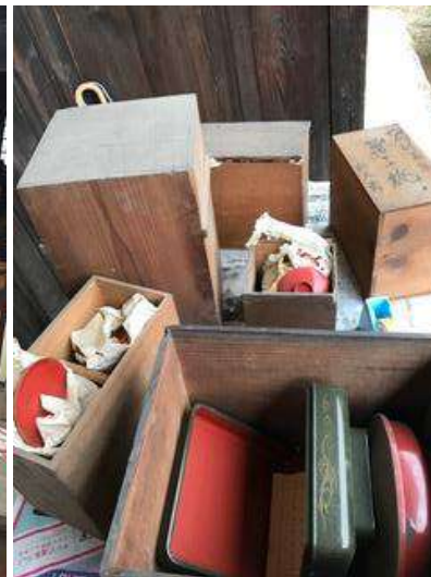
←県大生の手を借りて、 各部屋にあった古道具類 を整理