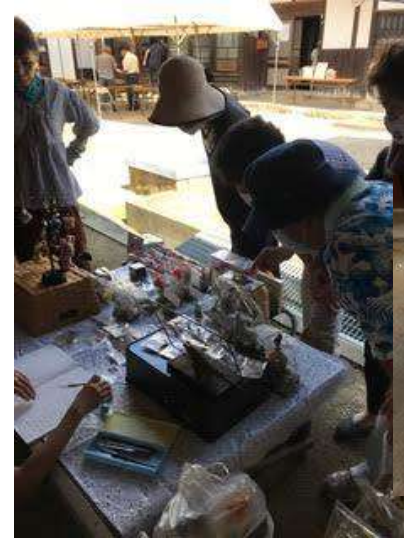
↑新たにハンドメイド雑貨のお店が参加