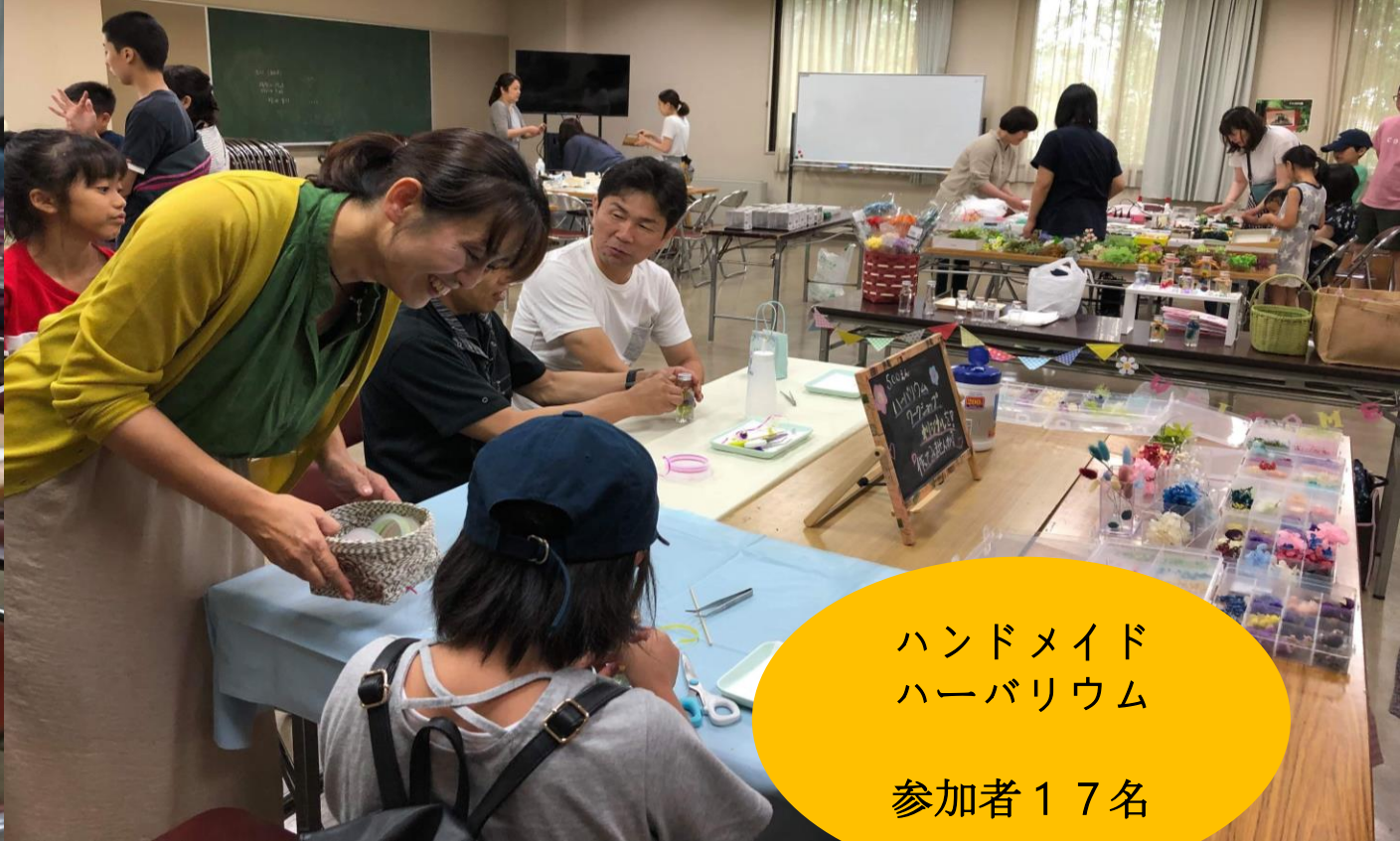
ハンドメイド ハーバリウム 参加者17名