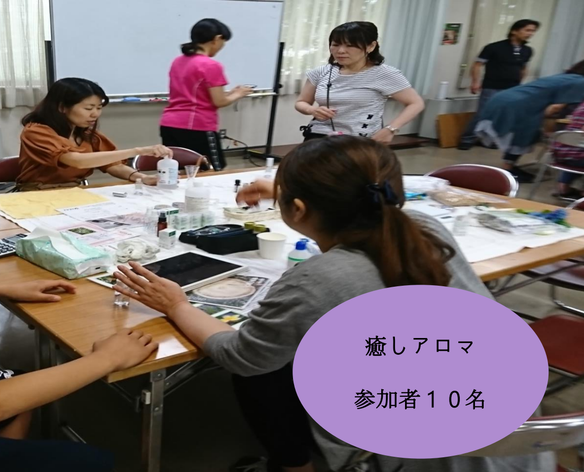
癒しアロマ 参加者10名