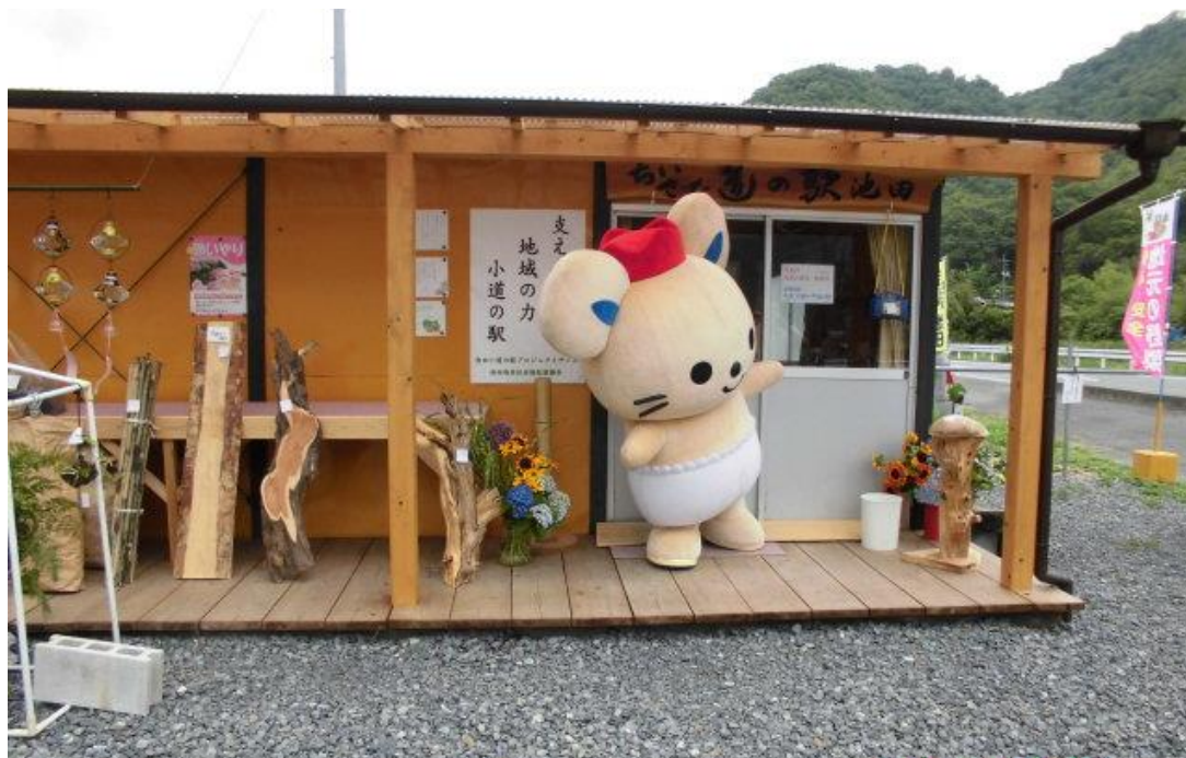
池田地区 小道の駅プロジェクト 〈代表 平田勝彦〉