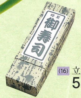
(16) 立飯 550円