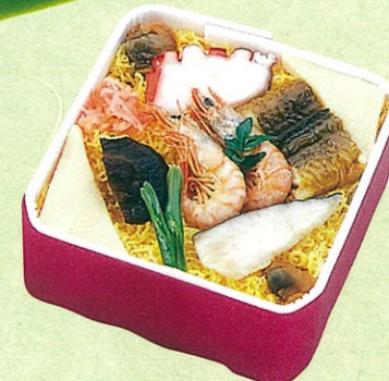
(15) 法事用バラ寿司 (1人前用) 750円