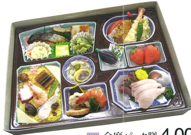
(10) 会席パック膳 4,000円