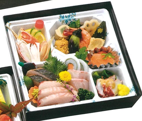
(8) 会席パック膳 6,500円