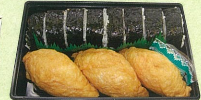
(21) 巻寿司・いなり巻詰合せ 900円