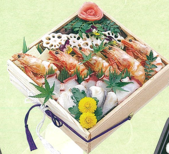
(22) 法事用延代寿司(3人前) 4,500円