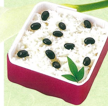
(13) 法事用白蒸し 600円