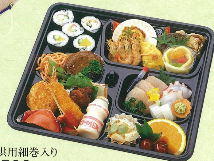
(23) 子供用細巻入り 2,500円