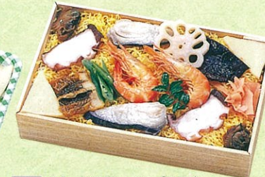
(20) 法事用バラ寿司 1,000円