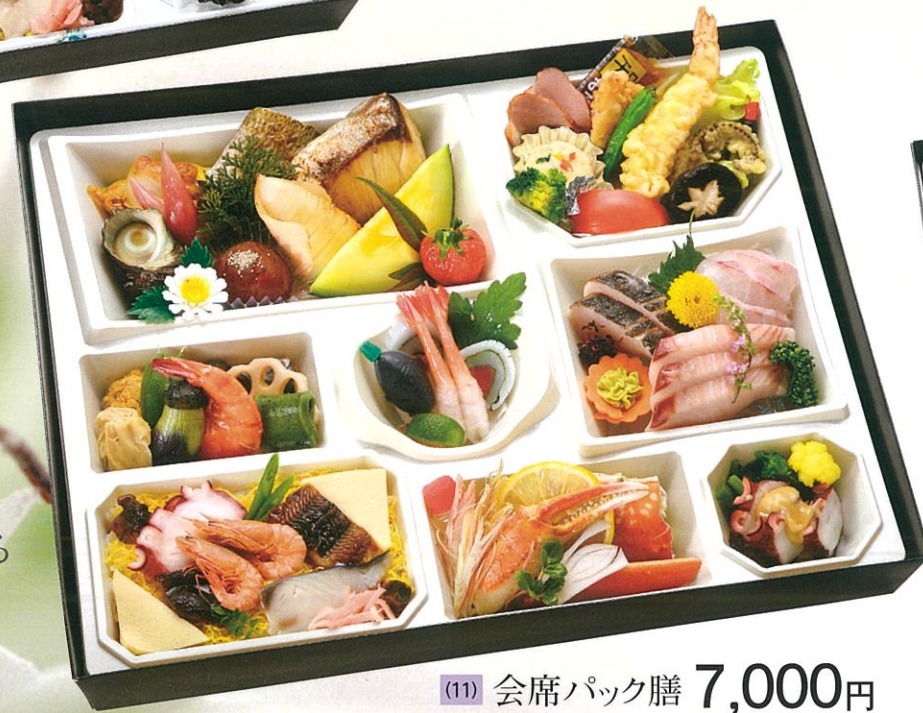
(11) 会席パック膳 7,000円