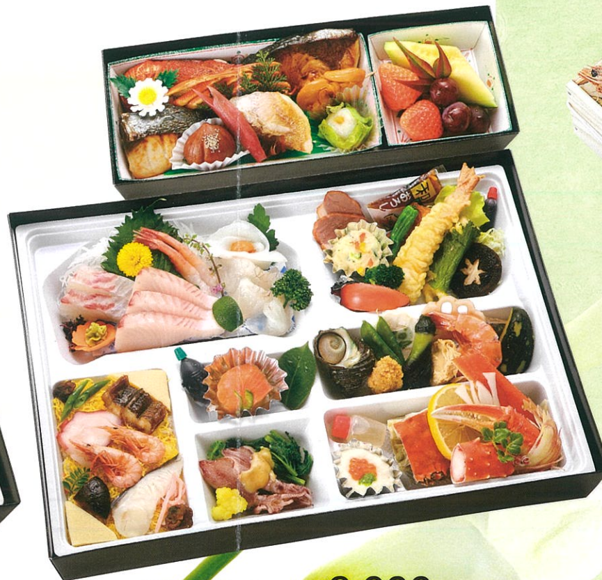
(12) 会席パック膳 8,000円