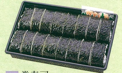
(17) 巻寿司 (2本入) 1,000円