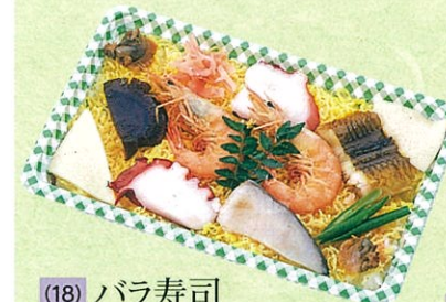
(18) バラ寿司 900円