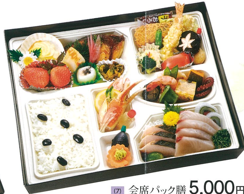
(7) 会席パック膳 5,000円