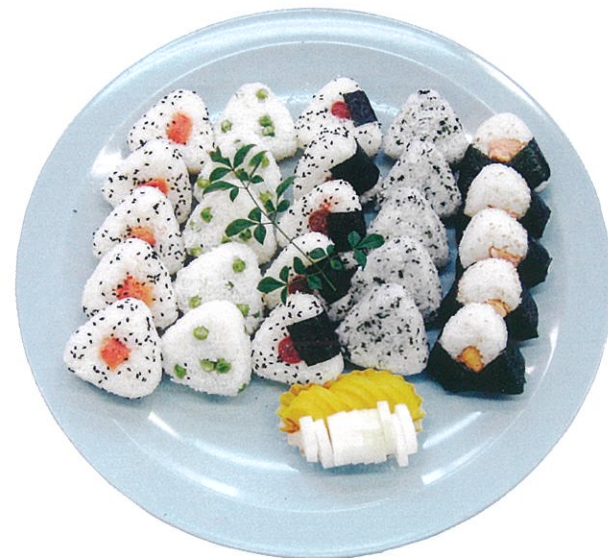
(28) おむすび (1個) 125円