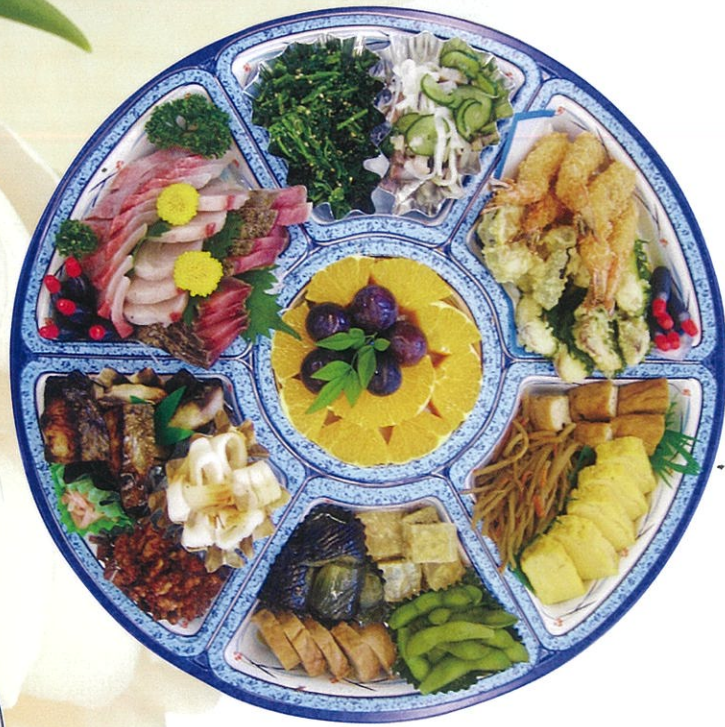
(25) オードブル (5~6人前) 11,000円