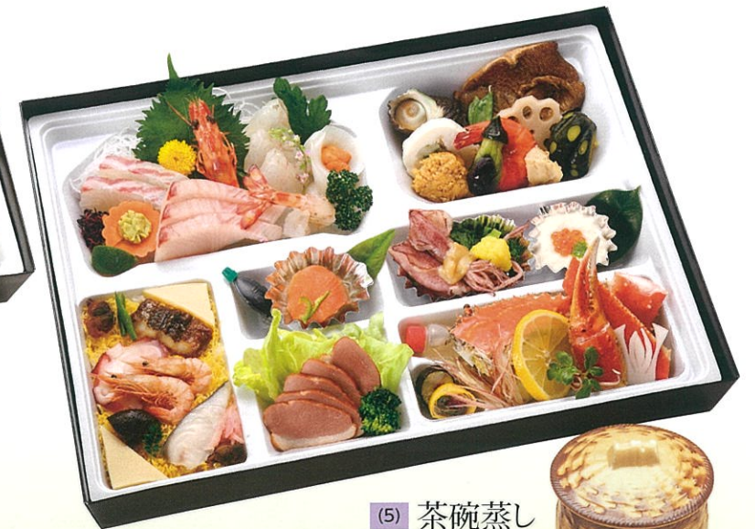
(3) 会席パック膳 10,000円