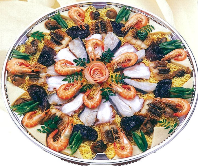
(26) ばら寿司 (5合) 5,000円