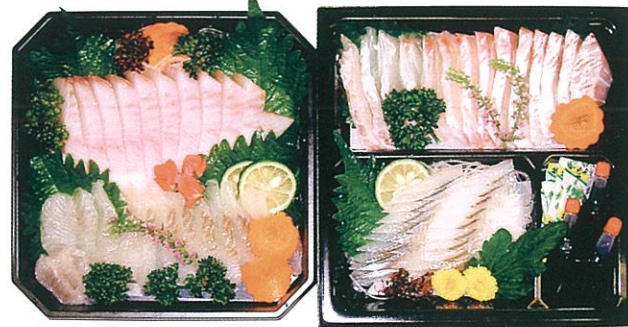
(27) 刺身盛合せ (5人前) 7,000円