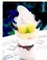
中のフルーツソースも 自家製のぶどうパフェ。