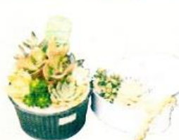
園芸コーナーには おしゃれなアレンジや雑貨も。