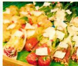
どの品も生産者が自信をもって出荷。