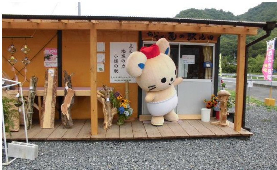
池田地区 小道の駅プロジェクト 〈代表 平田勝彦〉