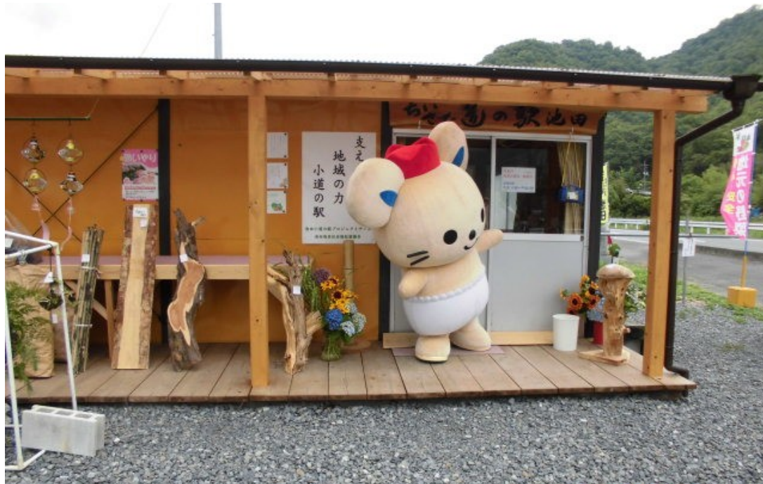
池田地区 小道の駅プロジェクト (代表 平田勝彦)