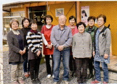
小道の駅プロジェクト委員会スタッフの皆さん