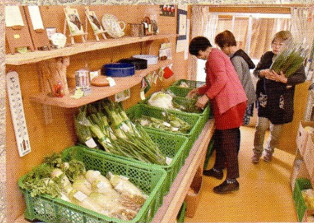
店内に所狭しと並ぶ地元で採れた野菜

住所 楨谷 3333 番地 2 営業時間 午前9時30分から午後3時まで 定休日 火曜日 電話 ☎ 9100