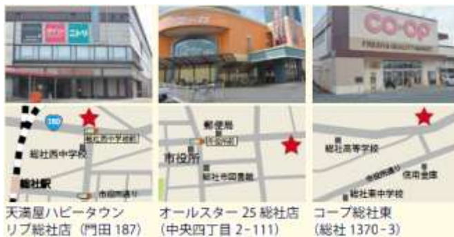
天满屋ハッピータウン リブ総社店（門田 187） オールスター 25 総社店 （中央四丁目 2-111） コープ総社東 （総社 1370-3）