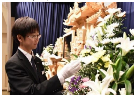
心を込めて作成し、美しく飾ります

岡山県南を主体にグループで18カ所の式場を運営する「葬祭企業」です。私たちのお仕事は亡くなられた大切な方に対して、ご家族の想いを「ご葬儀というセレモニー」に表現すること。お客様の精神的な支えに少しでもなれるように「温かい心遣い・思いやり」を大切にしながらすべてのスタッフは「ご家族の気持ちに応えたい」と努力をしています。葬儀の担当者を中心に案内係、司会者、お花の担当者など様々なスタッフの力を集結することで一つのセレモニーが完成されます。努力した分「達成感」や「やりが