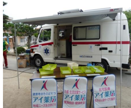
移動薬局車両で災害支援を行っています。

薬局から半径5kmの健康寿命を5歳のばします。県内に4店舗の調剤薬局を構え、それぞれの店舗が地域・お客様・社員に合わせた最適な空間がつかれるように最大限の努力をしています。ニーズをさきどりしたサービスを提供し、地域で必要とされる調剤薬局作りを目指しています。働きやすい職場、住みやすい地域を創りあげ、共に地域の健康を支え続ける仲間がアイ薬局にはいます。