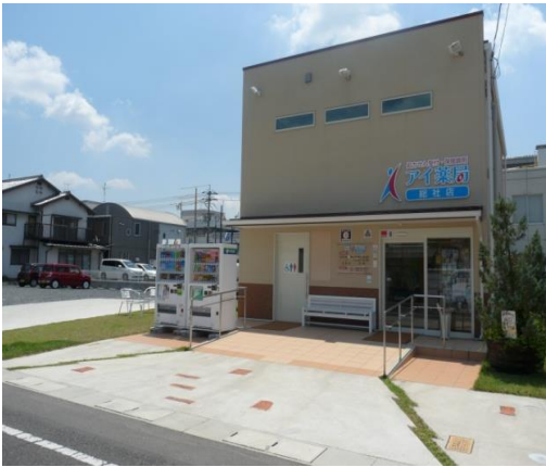
女性が多く育児と両立しやすい環境です！

〒719-1156 総社市門田507 TEL (0866)90-1001 FAX (0866)90-1002