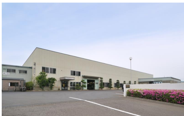
総社第二工場外観

総社第二工場 〒710-1201 総社市久代1920-2 TEL (0866)96-1061 FAX (0866)96-191