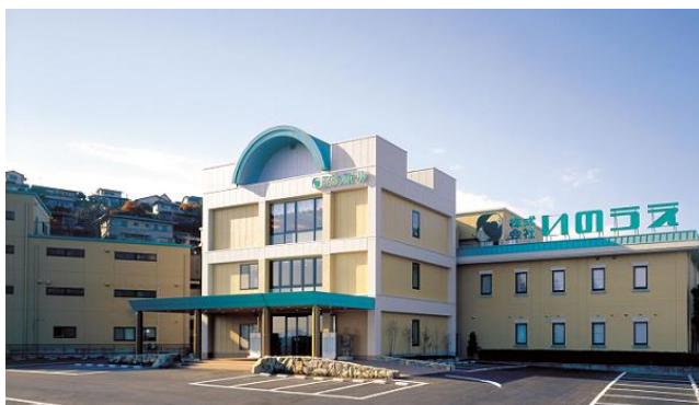
倉敷総本社 エヴァホール倉敷

〒719-1125 総社市井手1017-1 TEL (0866)90-1000 FAX (0866)92-7575