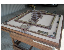
奏歴史遺産保存協議会