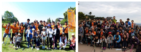
特定非営利活動法人 総社スポーツ&ヒューマン ねっとわーく

■問い合わせ先■ 〒719-1192 総社市中央一丁目1番1号 総社市人権・まちづくり課 国際・交流推進係 電話：0866(92)8242 FAX：0866(93)9479 メール：jinken-machi@city.soja.okayama.jp