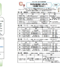
特定非営利活動法人 ほっとはあと