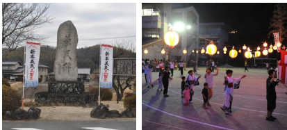
新本享保義民奉賛会