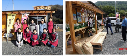
池田地区 小道の駅プロジェクト委員会