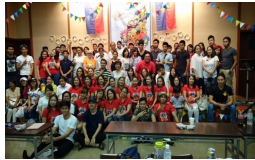
総社ブラジリアンコミュニティ& インターナショナルフレンズ