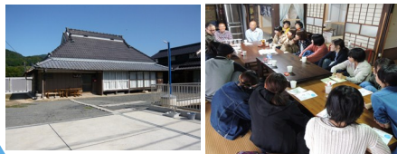
なっちゃん市運営実行委員会