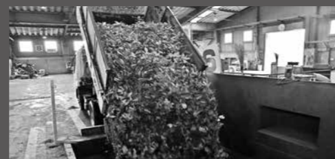
クリーンセンターに搬入する場合は有料です