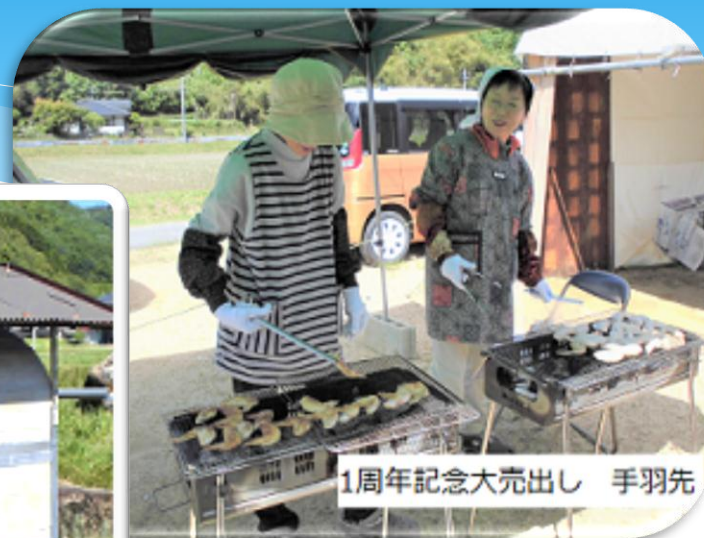
1周年記念大売出し 手羽先