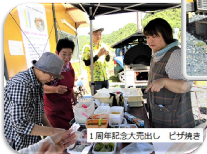
1周年記念大売出し ピザ焼き