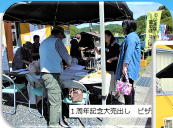
1周年記念大売出し ピザ