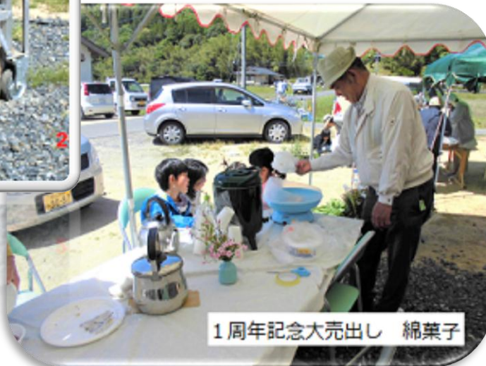
1周年記念大売出し 綿菓子