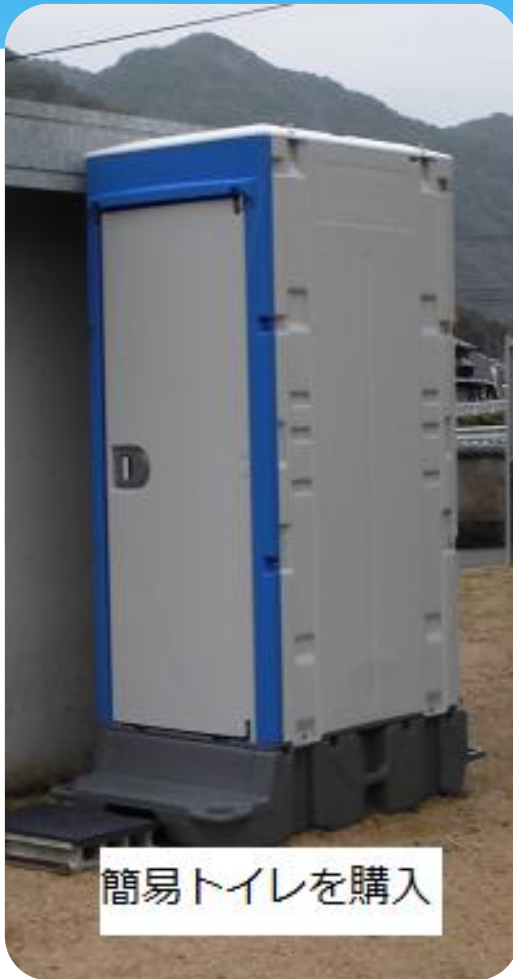
簡易トイレを購入