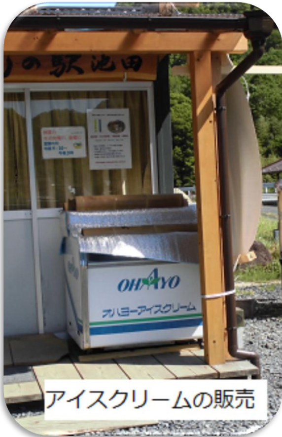
アイスクリームの販売