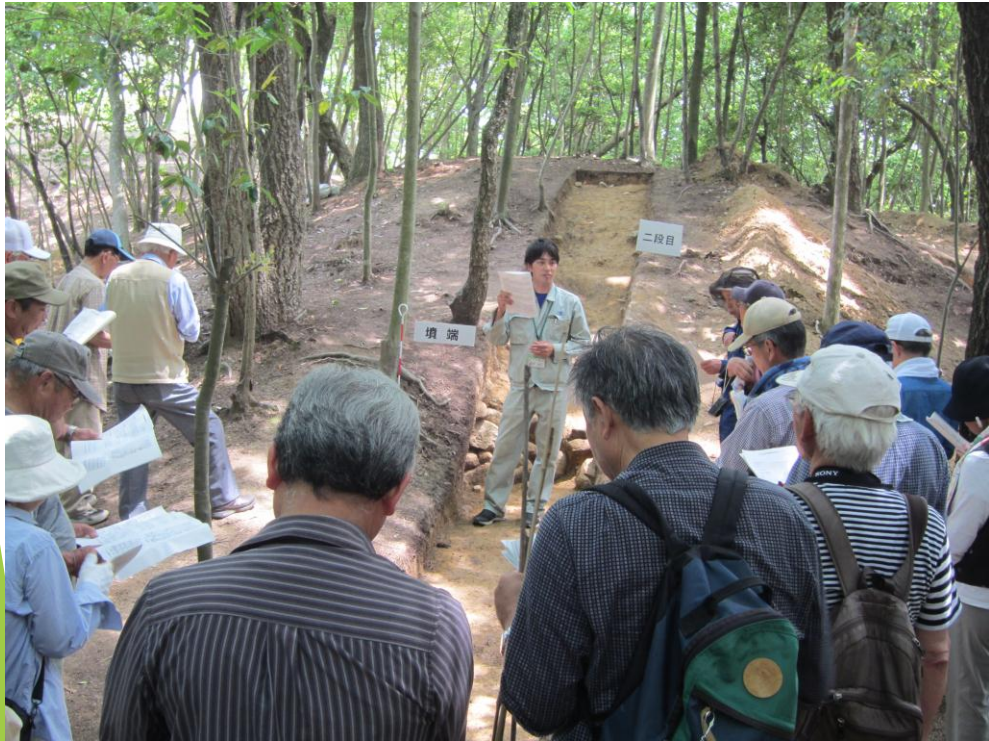
H30/5/27 (日) トレンチ調査後の現地説明会