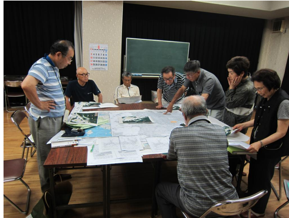
古代地形の調査、県下の地形(山)の標高調査