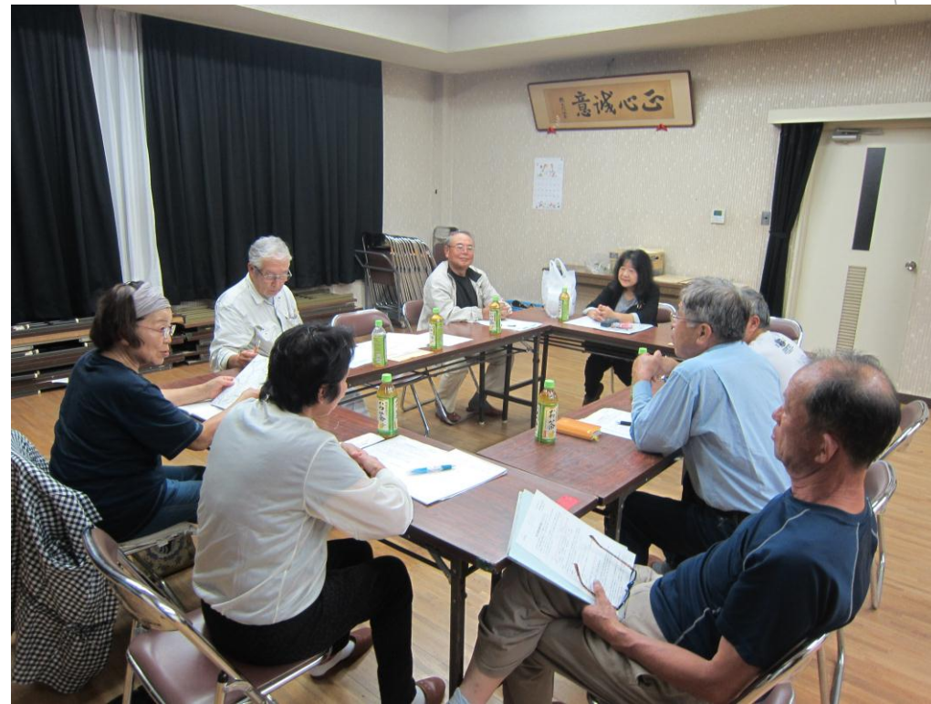
9/8（土）第三回プロジェクト会議