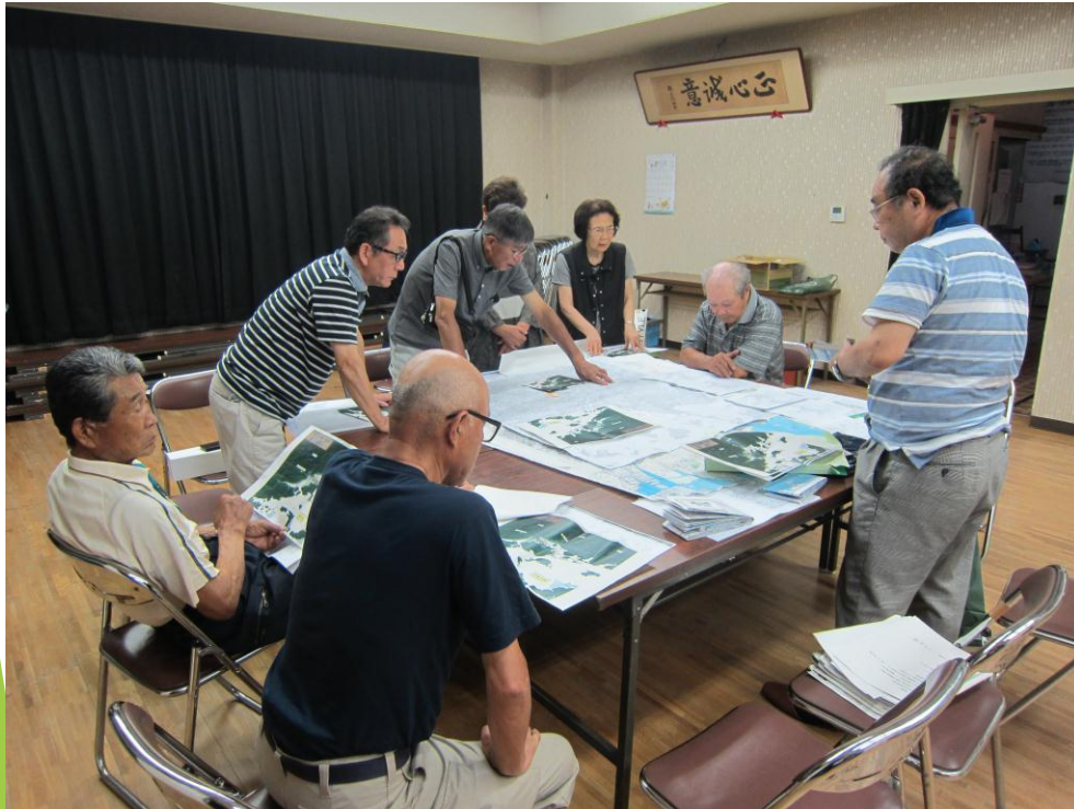
6/30 ( ) 第一回プロジェクト会議