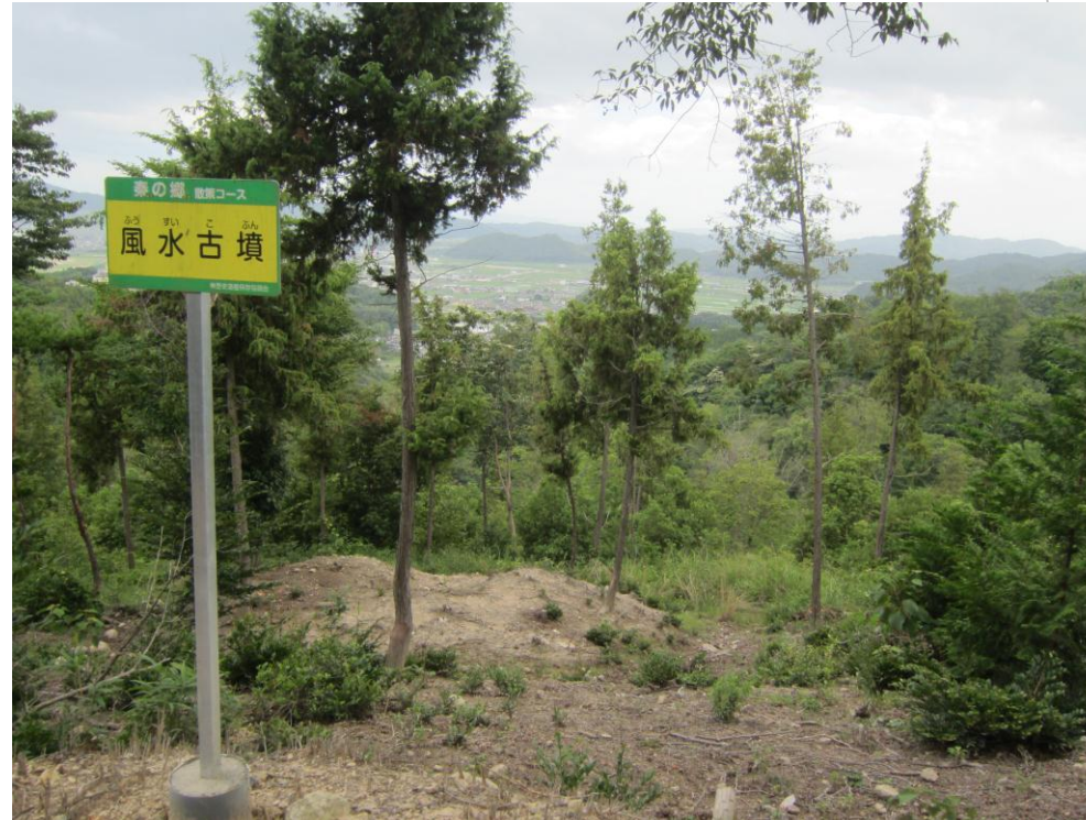
風水思想？(後方に山、前方に川等あり)