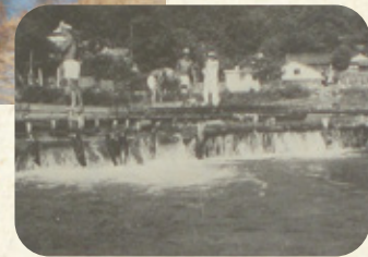
昭和27年頃の湛井堰