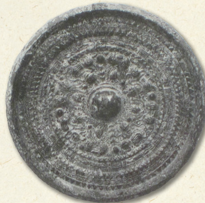
さんかくぶちしんじゅうきょう

～古代吉備の国の先進地域＝秦へのご招待 謎の秦氏と吉備王国、秦のロマンを求めて～