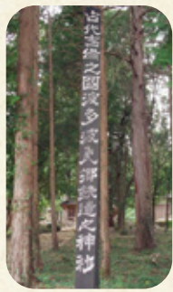
秦原郷鉄造之 発祥の地