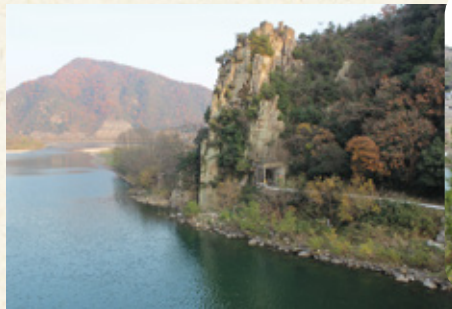
高さ約 60 メートルの御神体の磐座