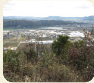
城跡からの展望 (東)