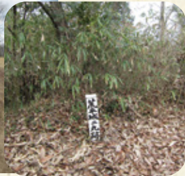
土堀で造った砦跡 (二丸)