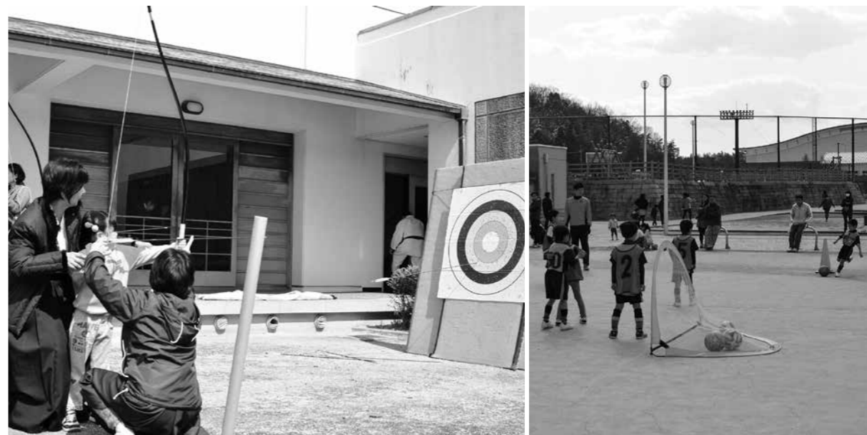
そうじゃわくわくフェスティバル 弓道体験（左）、サッカー教室（右）