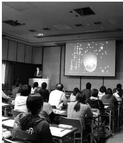
人権教育担当者研修会（左）、巡回ふれあい講演会（右）