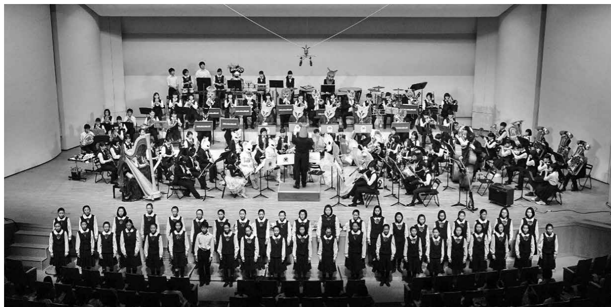
第3回総社芸術祭 2017 より 音楽の絵本