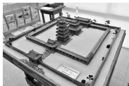
秦廃寺伽羅配置模型 (秦歴史遺産保存協議会制作)