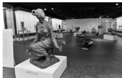
第3回総社芸術祭 2017 より 展示（一部）

そして、主要な整備事業が完了し、新たな課題に対応するため、平成28年度に『史跡鬼城山（鬼ノ城）環境整備第2次基本計画』を策定した。現在、遺構の再整備や維持管理を中心にさらなる活用を図るため整備事業を計画的に進めている。