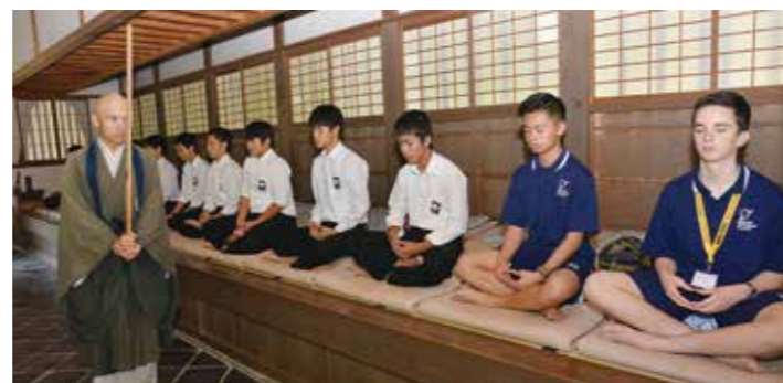
井山宝福寺で座禅体験をするメルトン・セカンダリー・カレッジと昭和中学校の生徒

市とメルトン・セカンダリー・カレッジは相互に生徒の受け入れを行っており、昭和中学校への訪問は今年が2回目です。