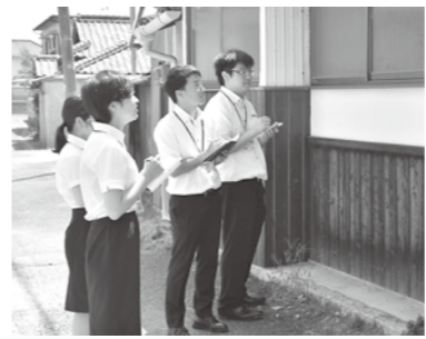
空き家調査に同行

私 は、興味本位で行った説明会で職員の熱意に感化され、総社市役所のインターンシップに参加しました。 10日間という短い期間に、政策調整課と農林課の業務を経験でき、良い意味で市役所のイメージが大きく変わりました。 総社市のインターンシップは仕事を体験して終わりではなく、政策を考え発表するまでが課題として与えられます。自分が実際に体験したことを基に1人の市民として、また市役所の職員としてこれからの総社市には何が必要かを真剣に考えました。 例えば、公園を新しくつくってほしいと要望を言う