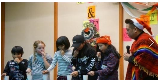
（去年圣诞节的情景）