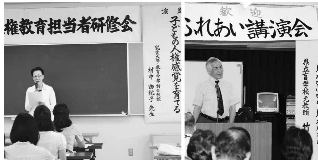
PTA 人権教育担当者研修会(左)、巡回ふれあい講演会(右)