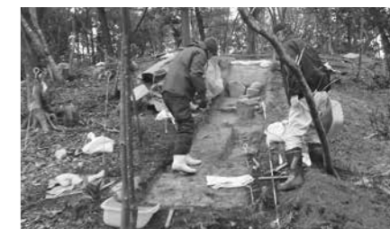
一丁坊15号墳発掘調査