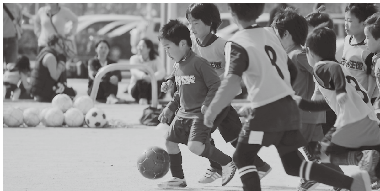
わくわくサッカー