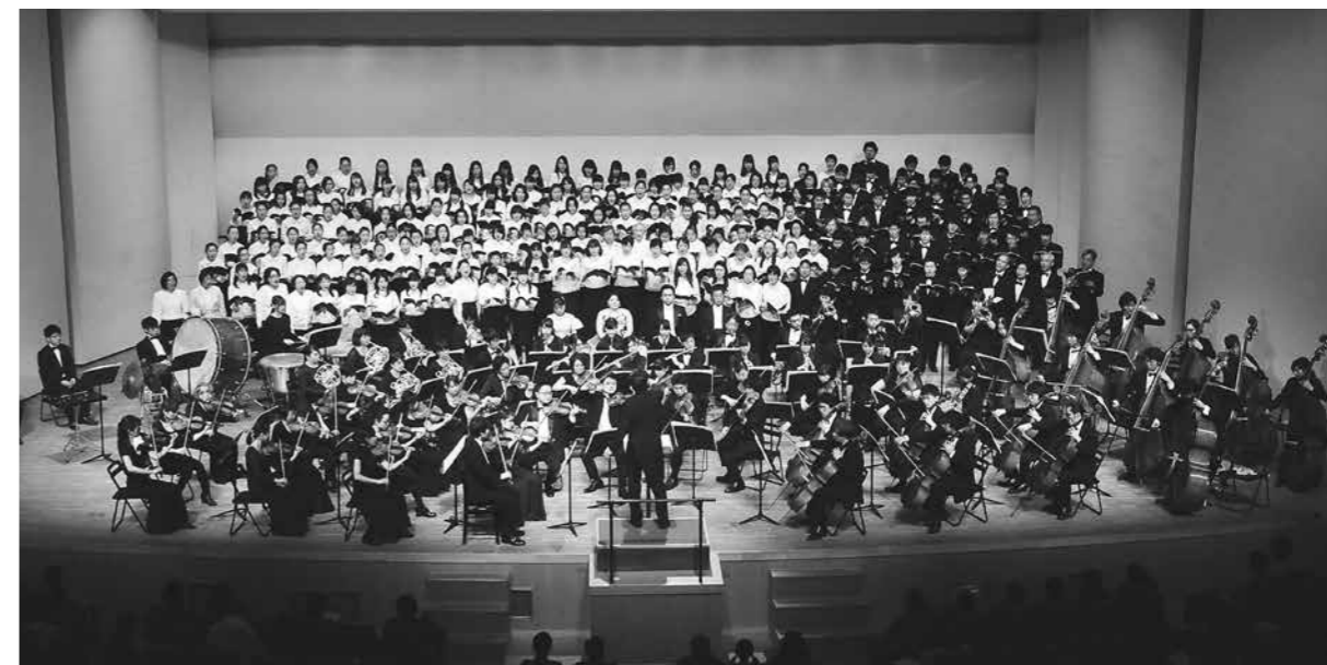
H27年に開催した「はじめての第九」