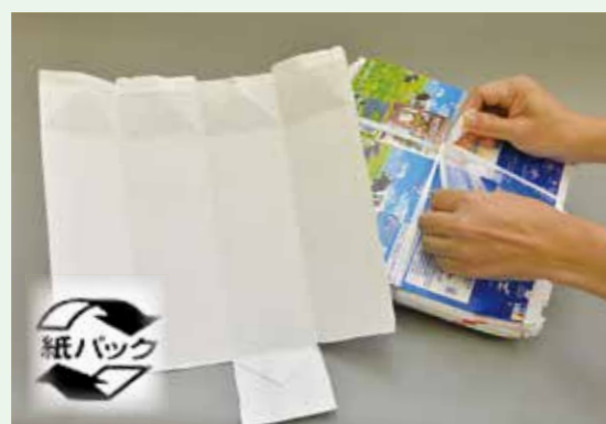
開いて乾かし、ひもで縛った紙パックと紙パックマーク

牛乳やジュースなどの容器を「紙パック」といい、「紙パックマーク」が印刷されています。紙パックは中を洗い、切り開いて乾かし、ひもで縛って古紙の日に資源ごみとして出すことができます。小さなジュースなどのパックも紙パックマークが付いていれば、同じようにして古紙の日に出すことができます。