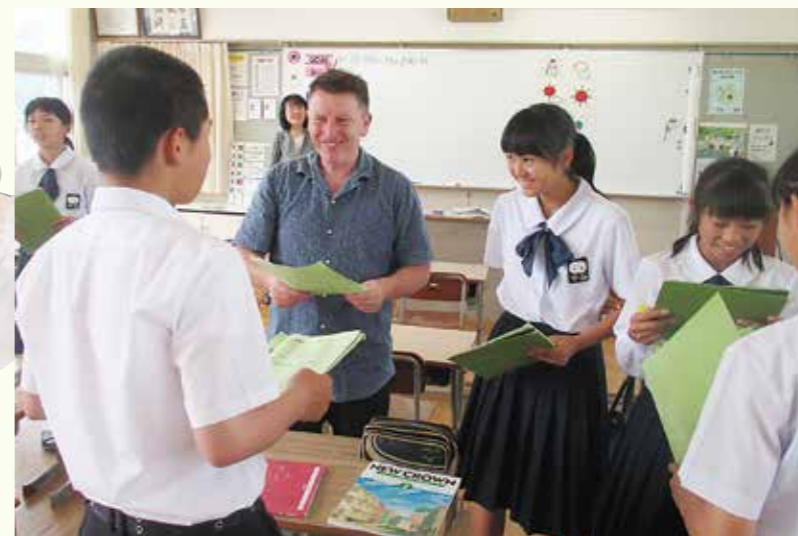
ALT(外国語指導助手)と会話の練習をする昭和中学校の生徒