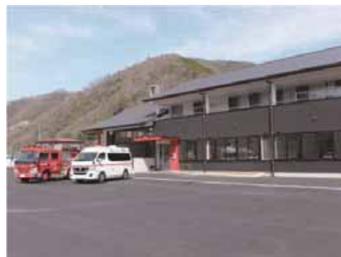
消防署昭和出張所