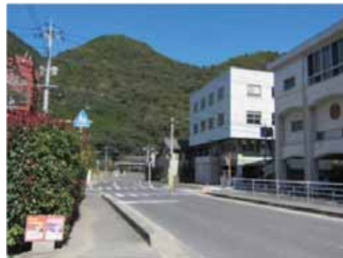
地域拠点（JR美袋駅周辺）