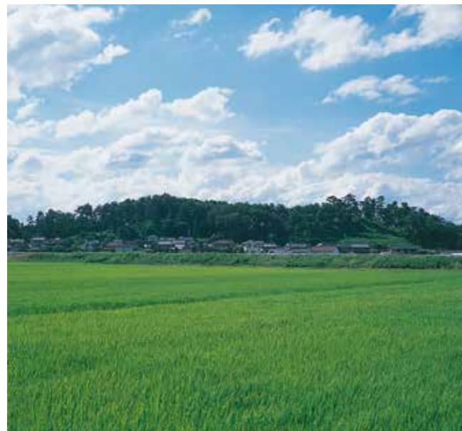
作山古墳 Tsukuriyama burial mound