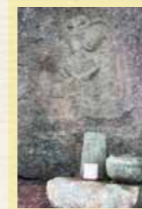
③ 磨崖仏 八畳岩の麓