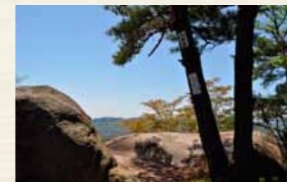
太郎岩からの展望