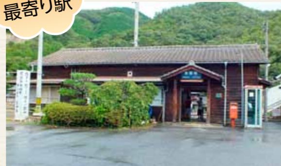
大正末期の駅舎の特徴を残す美袋駅 (登録有形文化財)