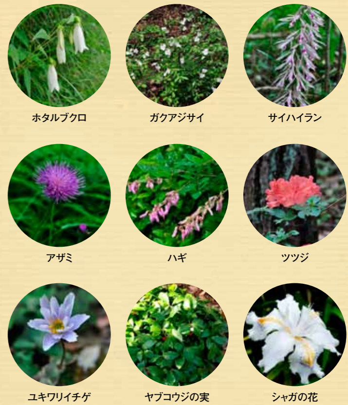
ホタルブクロ ガクアジサイ サイハイラン アザミ ハギ ツツジ ユキワリイチゲ ヤブコウジの実 シャガの花