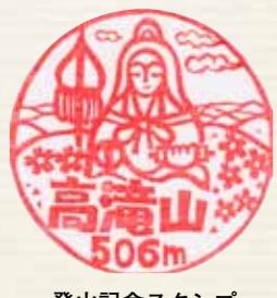
登山記念スタンプ (八畳岩上の記帳箱内)