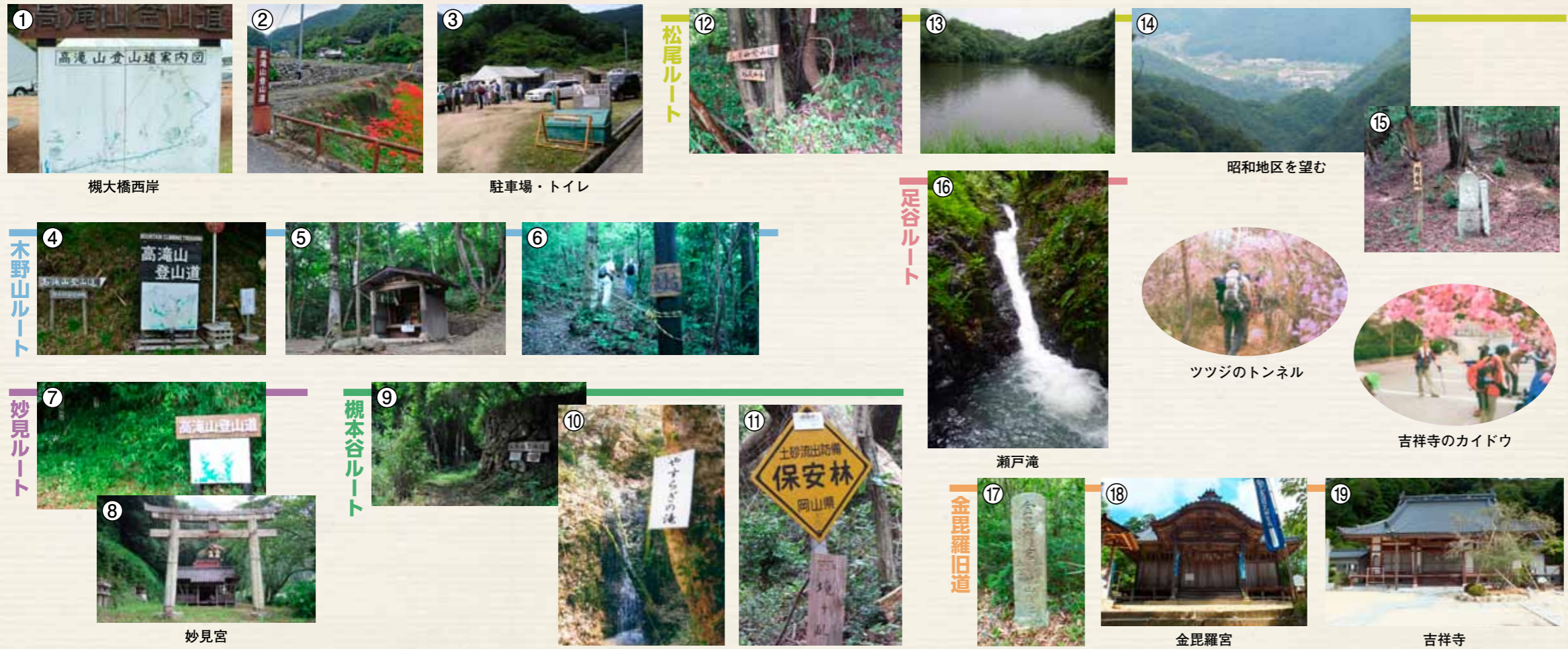
1 槻大橋西岸 2 駐車場・トイレ 3 松尾ルート 4 木野山ルート 5 妙見ルート 6 槻本谷ルート 7 妙見宮 8 高滝山登山道案内図 9 高滝山登山道 10 やすらぎの滝 11 保安林 12 松尾ルート 13 昭和地区を望む 14 足谷ルート 15 吉祥寺のカイドウ 16 瀬戸滝 17 金毘羅旧道 18 金毘羅宮 19 吉祥寺