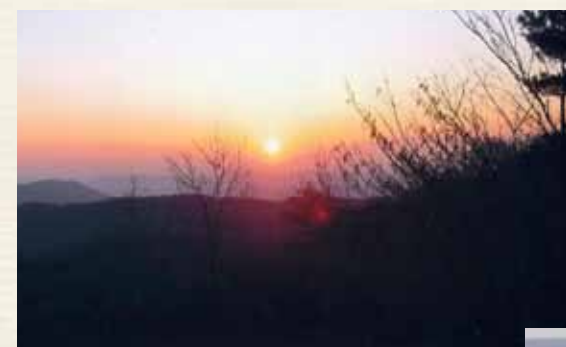
初日の出 (山頂岩山より)