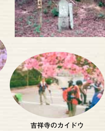
吉祥寺のカイドウ