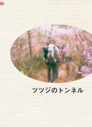
ツツジのトンネル