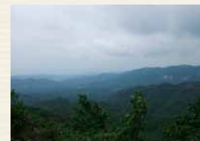
八畳岩からの展望【玉島方面】