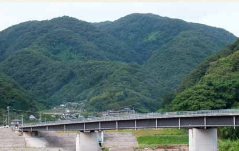
槻大橋の奥に高滝山をのぞむ