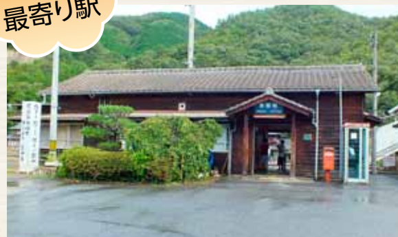
大正末期の駅舎の特徴を残す美袋駅 (登録有形文化財)