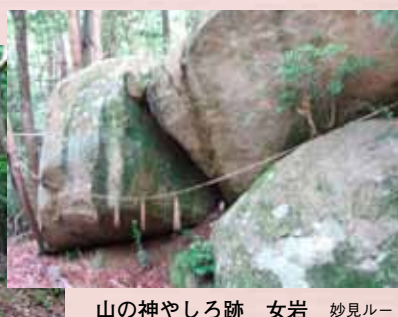
山の神やしろ石 女岩 妙見ルート