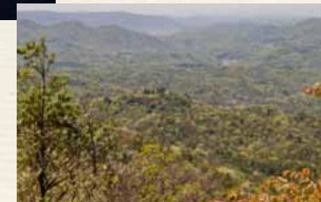
蛇岩からの展望【暹照山・笠岡方面】