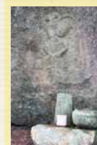
③ 磨崖仏 八畳岩の麓