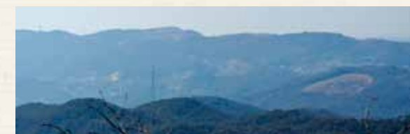
次郎岩からの展望【暹照山・難山・大山方面】