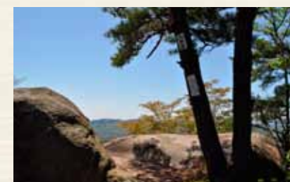
太郎岩からの展望