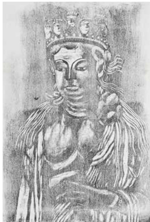
十一面観音 / 森文雄 1991年 木版画

歌川広重、棟方志功、平塚運一、笹島喜平、橋本興家、畦地梅太郎、斎藤清、橋口五葉、浜口陽三、竹久夢二、北岡文雄ほか