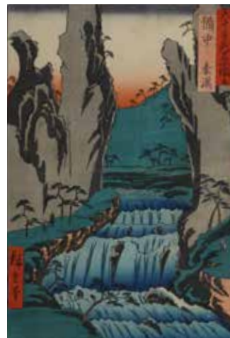
六十余州名所図会「備中豪渓」 / 歌川広重