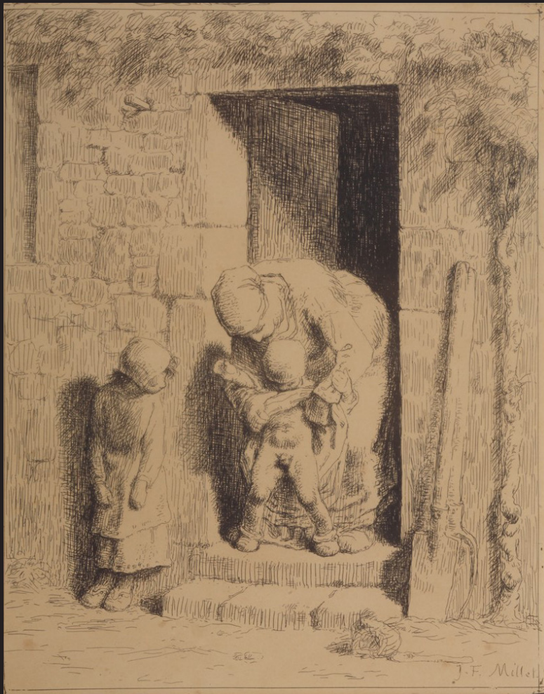
母親の思いやり ジャン・フランソワ・ミレー