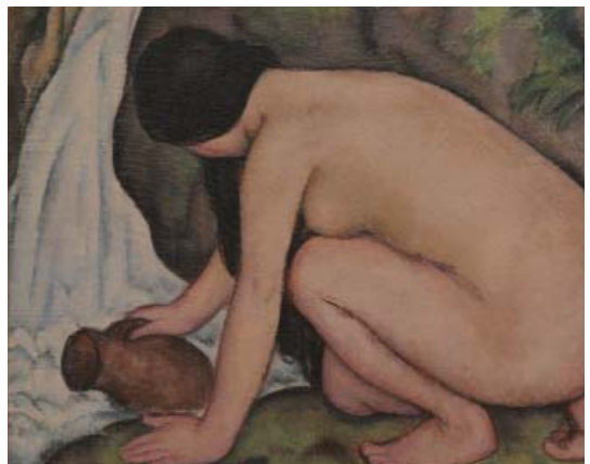
源泉のエチュード 油彩 1918 (大正7)年