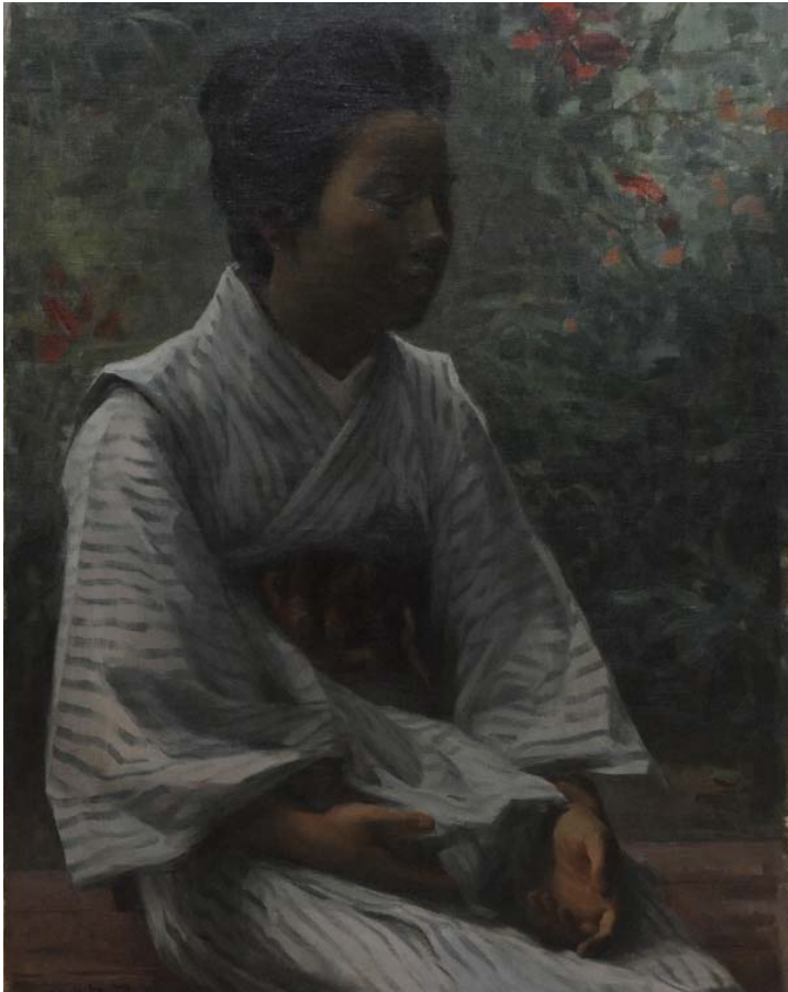
少女 油彩 1906 (明治39)年

本展示では、総社市と総社市文化振興財団が所蔵している作品約40点を展示。その大半は、2回目の渡欧から帰国した後、画風に苦悩し、それを乗り越えようと努力した時期にあたるものです。