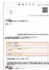
個人番号カード交付通知書