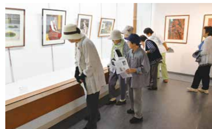
色を重ねた版画を熱心に見入る来場者