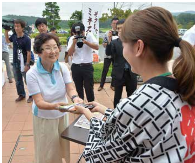
試食販売会場で、ミネストローネを購入する買い物客