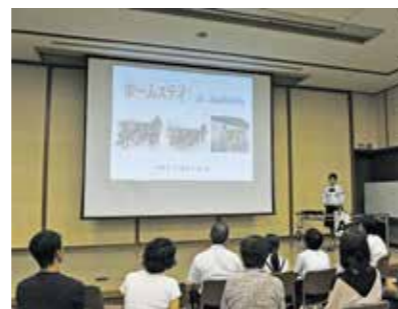
英語を交えて発表する中学生

7月28日から13日間、オーストラリアでホームステイをした市内の小・中学生21人が、8月29日、総合福祉センターで帰国報告をしました。海外研修で語学や文化に触れた体験から学んだことを一人ずつ発表していました。