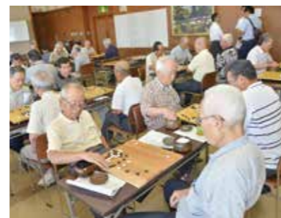
碁石を打つ手に力が入る

老人クラブ夏季囲碁大会が8月27日、総合福祉センターで開かれ、市内の老人クラブの会員ら約50人が競い合いました。参加者は、碁盤を見つめ、対戦相手の打つ手に集中して次の一手を考えていました。