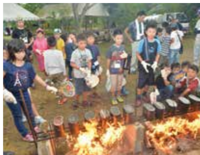
飯ごう炊さんに挑戦

8月29日と30日の両日、鍵水キャンプ場（岡山市北区）で自然学校が開かれました。市内の小学生34人が参加。木工や池での水遊び、飯ごう炊さん、キャンプファイヤーなどで大自然を満喫していました。