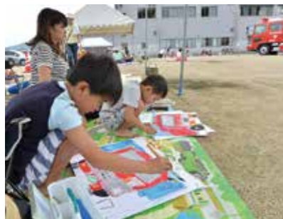
熱心に消防車を描く子ども

9月5日、消防写生大会が消防庁舎グラウンドで行われ、市内の幼稚園児や小学生など約200人が参加しました。近くで見ると、絵の具やクレヨンを使って画用紙いっぱいに描いていました。