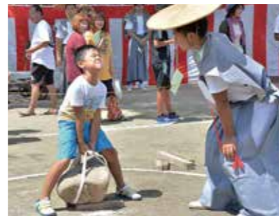
全身で石を持ち上げる参加者

8月23日、総社宮で「力石総社」が開催され、子どもから大人まで約300人が持ち上げる石の重さを競いました。腰を落とし、汗ばむ手で歯を食いしばりながら綱を引き、自分の体重以上の石に挑戦していました。