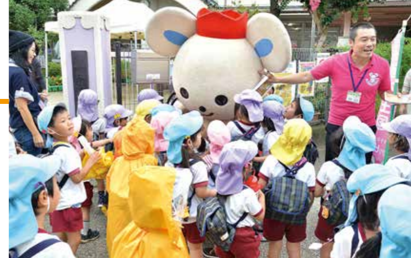
市内各地でPR活動に奮闘するチュッピー

投票は、インターネットで、11月16日（月）まで受け付けています。チュッピーに熱い応援をよろしくお願ひします。