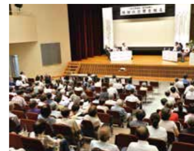
専門家の話に聞き入る

8月23日、山手公民館で西郡地区住民が中心となり企画した防災講演会が開催されました。参加者は、大学教授らから地域で災害に備える重要性を学んだり、起震車による地震体験を行って防災意識を高めていました。