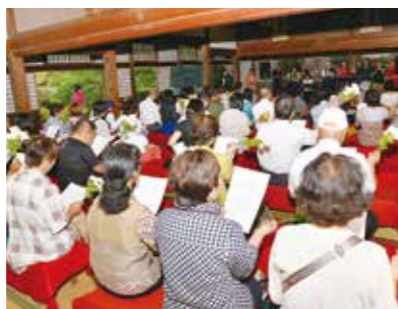
バンドの演奏に聞き入る観客

9月6日、井山宝福寺で東日本大震災復興支援チャリティーコンサートが開催されました。「きずな」をテーマに6団体が自慢の演奏を披露し、訪れた約100人の来場者は、奏でられる音楽にリズムをとり、楽しんでいました。