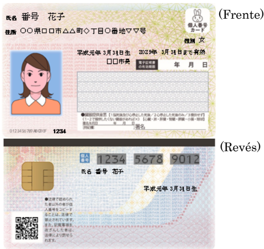
【Tarjeta de número personal】