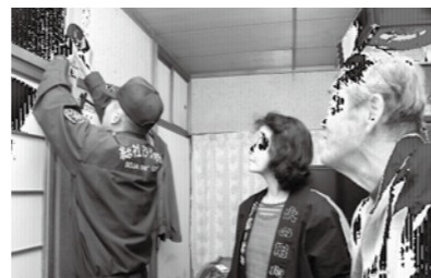
一人暮らしのお年寄りの家に住宅用火災警報器を設置する市消防職員

住宅用火災警報器設置の義務化に伴い、全国的に住宅火災による死者が減少傾向にあります。いまだ年間に約1000人の人が亡くなっています。未設置の家庭は、早急に設置してください。