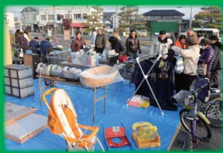
過去に行ったイベントの様子

総社市では、再利用を進めていくため、「不要になったものがあるけど、まだ使えるのでゆずりたい」、「中古でもいいので、欲しいものももらえれば助かる」などの声をまとめ、ゆずりたい人とゆずってもらいたい人の橋わたしを行っています。