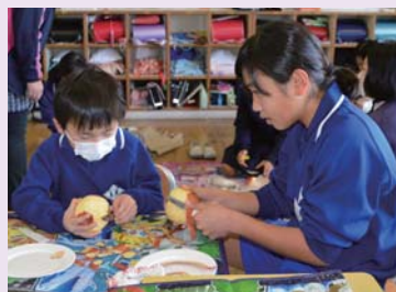
りんごの皮むきに挑戦

新本小学校では2月17日に「りんご皮むき集会」が行われました。この行事は、お父さんやお母さんが子どものころから行われてきた行事です。