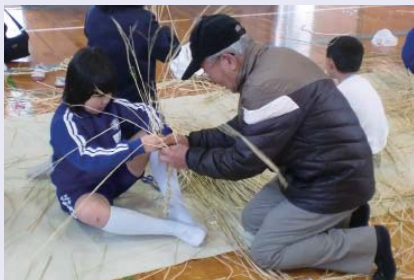
わら細工づくりに挑戦

総社北小学校では、毎年、地域の人に講師になっていたいて、わら細工づくりを行っています。今年度は、12月4日に地域の32人の人に教えてもらいながら、6年生はめがね型のしめ縄、5年生はリース型のしめ縄、4年生はわら縄を作りました。