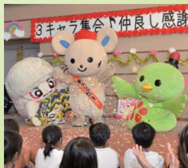
矢掛町で行われた感謝イベント