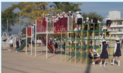
新しい遊具は大人気

この遊具の西側には、「はばたけ常盤っ子」という創立100周年記念の石碑が建っています。みんなで仲良く共に体をきたえ、豊かで元気に学校生活を送りながらはばたいていきたいと思えます。