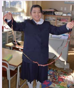
今年のチャンピオン

1年生から6年生まで全員が、1人に1つずつりんごをもらって、できるだけ皮を途中で切らないようにむいていきます。この日をむかえるまでに、一生けん命練習して臨みますが、うまくいかなかったり、なかには手を切ってしまうたりする友達もいます。しかし、最高記録を目指して根気強く取り組む姿が毎年見られます。