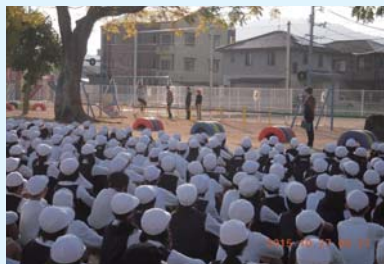
先生から遊具の使い方を教わります