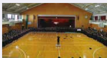
全校生徒で歌った「大地さんしょう」

生徒たちのきずなが深まる「合唱集会」は、総社西中学校ならではの素晴らしい行事です。