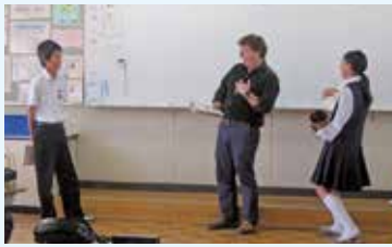
外国人の指導助手による英語の授業

昭和中学校には、英語特区というほかの学校にはない取り組みがあります。学校の至る場所に英語があふれ、外国人の指導助手と授業以外でも楽しくコミュニケーションができています。