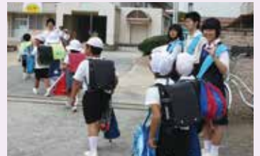
「あいさつ大使」が大活やく

また、今年からは総社中学校区の4小学校へ「あいさつ大使」としてうかがっています。これは、あいさつを通して小学生とふれ合い、学区全体にあいさつの輪を広げていくこと、そして小学生が安心して中学校に入学できることを願い、行っている活動です。