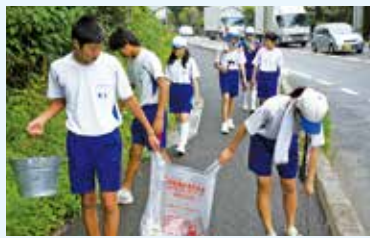
協力してそう除するちょボラtime

このように昭和中学校では、地域の人やほかの学年などとの連けいを深める活動を行っています。私たちは、今後さらに交流活動を発展させ、昭和中学校ならではの、特ちょうのある取り組みを増やしていきたいと思っています。