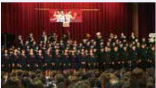
3年生による学年合唱