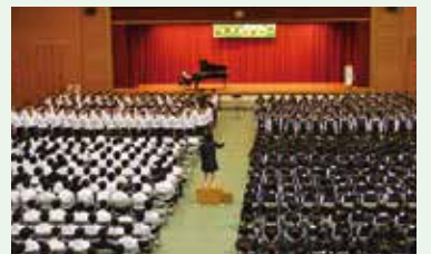
感動で包まれた3年生の合唱

午前中は全学年による合唱コンクールを行い、各クラスが歌うごとに心地良いきん張感や感動を味わうことが