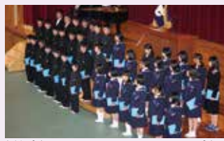
新入生をむかえるかんげいの歌

入学式でのかんげいの歌も今年初めて行いました。拡大しつ行部と有志の生徒が集い、新入生に感謝とかんげいの気持ちをこめて歌いました。今までとは一味ちがう入学式になったと思います。