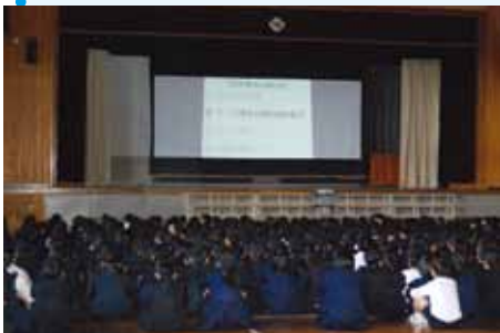
全校で集まって開会式

今年度は「ニコニコ祭」という名前で11月26日に開催しました。クイズや暗夜行路、的当て、ボーリングなど楽しいお店がたくさんありました。1年生から6年生までが楽しく遊べるように工夫されていました。どのお店にも多くの人が集まって、ニコニコ笑顔で遊んでいました。お店を出す人も、遊びに行く人もニコニコ祭が盛り上がるようにしていました。