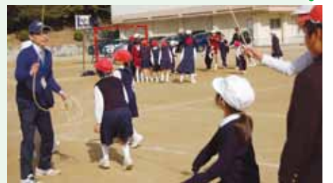
記録更新を目指す

大会本番の2月10日、「いちっ、にっ、さんっ、しっ……」みんなで声を合わせて数を数えます。私たちの班は、最初の練習の日、全体の班のなかで最下位だったのに、本番では3位になることができました。いっしょにがんばってきて、班のみんなとの絆がさらに深まったようで、うれしかったです。