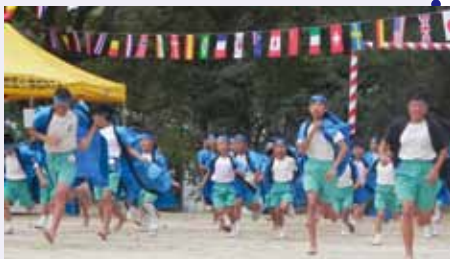
さあ出発! みんなでおどろう

縦割り班対抗で走力を競い合った「紅白対抗全員リレー」。観客席からは大きなはく手や歓声があがり、運動会は大いに盛り上がりました。あまりの熱気に、名