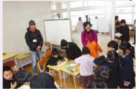
ゲーム「こびとさがし」コーナー

阿曾小学校では、毎年、児童会がフェスティバルを開いています。今年は1月26日にあり、ターザンロープでスリルを味わう「サスケ」、運動能力を試す「フリースロー」、頭脳だめしの「クイズコーナー」など、縦割り班ごとに8つのお店を出しました。めあては「協力」と「お客さんが楽しめる」です。「1年生は、どんな役ならできるかな」、「どうやったらみんなに楽しんでもらえるかな」など、6年生が中心になっていろいろと考えて、準備をしました。日ごろお世話になっている人も招待しました。日曜日なので、小さい子からお年寄りまで、たくさんの方でにぎわいました。フェスティバルの後のPTAバザーでは、「うどん」や「おにぎり」などの販売もあり、家の人と食事をしながら会話ははずみませんでした。