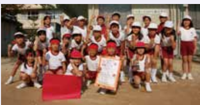
秦っ子リレーの伝統を守っていきます

6年生がリーダーとなり、みんなで作戦を考えながら走る順番を決めます。バトンやゼッケンの準備、並び方の確認、リレーの進行や表しようなども運動委員会ですべてやります。この取り組みをとおして、学年のかべをこえて協力し、仲を深めることができるのが秦っ子リレーのよさだと思います。みんなできん張感もちながら、あきらめずに走ることがとても楽しいです。「自分で考えて、みんなのために行動する大切さ」