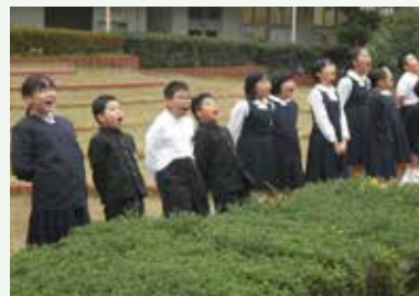
大きな声であいさつをする

総社小学校では、目標の1つである「やさしい子」を目指して、計画委員会や生活委員会が中心となってあいさつ運動を行っています。毎朝、ピロティーに立ってあいさつをしたり、中庭から校舎に向かって大きな声であいさつを