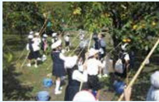
柿がりにちょう戦

うれしかったことは、柿のおいしさです。家で食べるよりあまくておいしかったです。柿ぜんざいも食べてすごく満足しました。また柿がりに行って、いっぱい柿が食べたいです。