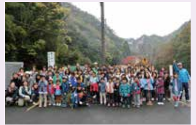
全員で記念さつえい

そう除が終わって、きれいになった豪溪の紅葉をバックにみんなで記念さつえいをしました。休みの日の早起きは大変でしたが、すがすがしい笑顔のいい写真がとれました。