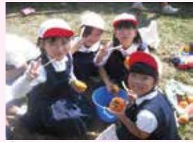
採れたてはおいしかったよ

柿がりは、先にふくろのついた長い棒でひっかけて柿を取ります。かたくて枝が折れそうで心配でしたが、どんどん慣れてきました。うでが痛くなったけど、力を入れたらうまく取れました。