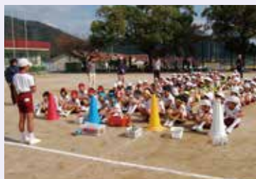
6年生がリーダーとなり、みんなをまとめます

秦小学校には、年3回、縦割り班対この「秦っ子リレー」があります。このリレーは、私たち6年生が入学するよりもずっと前から続いています。今年からは縦割り班を4色のチームにわけて、全校児童102人が1つのバトンをつなぎました。