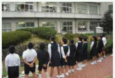
校舎のみんなにも声が届いたよ

これからもあいさつ運動を続けて、あいさついっぱい総社小学校にして、地域にも元気と笑顔を広げたいと思います。