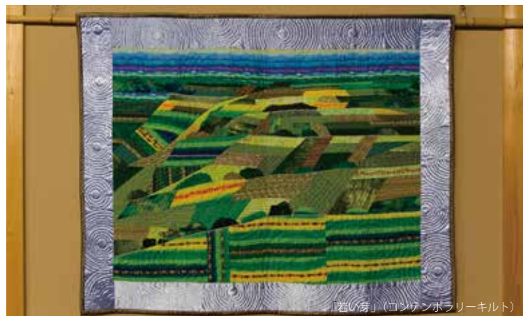
「若い身」(コンテンポラリーキルト)

ところ 阿曾房と伊丹宅 [総社市東阿曾1832-2] ※伊丹宅は阿曾房の向かいの家