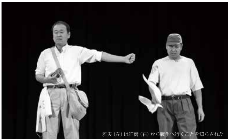
雅夫(左)は征爾(右)から戦争へ行くことを知らされた