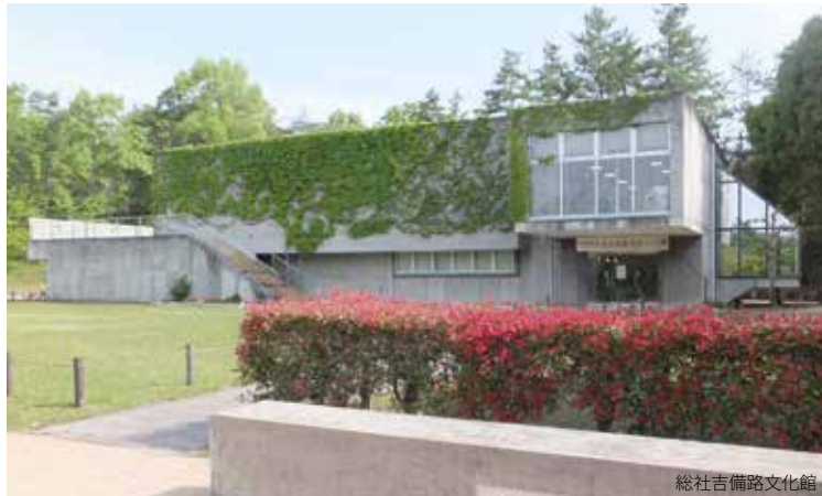
総社吉備路文化館