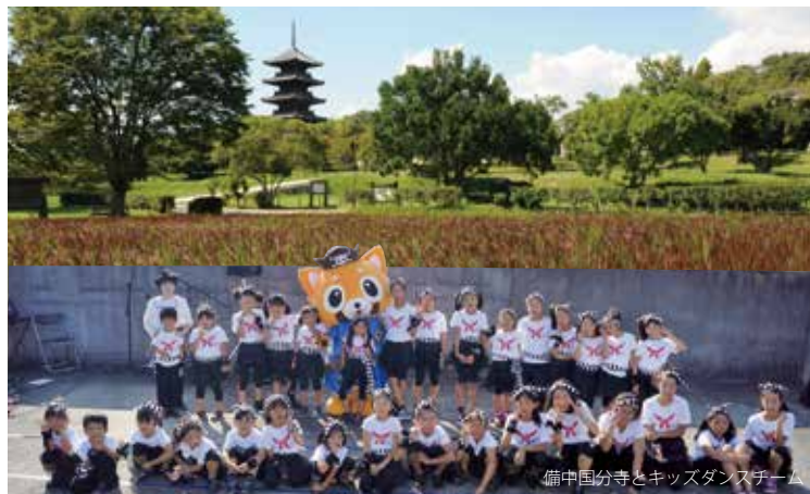
備中国分寺とキッズダンスチーム