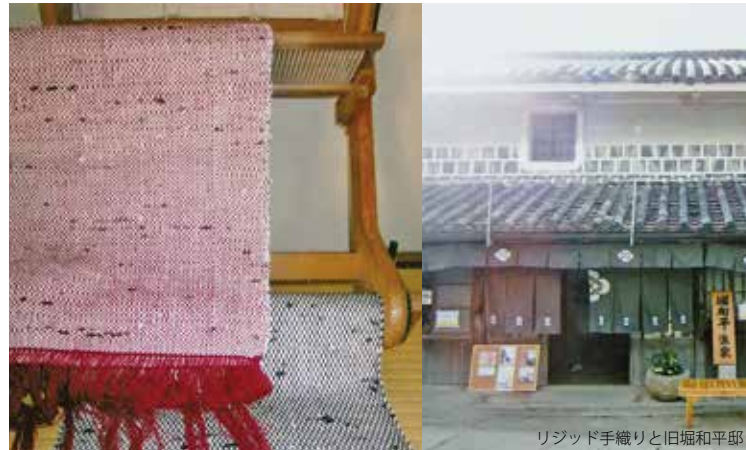
リジッド手織りと旧堀和平邸