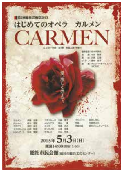
「カルメン」のポストカード