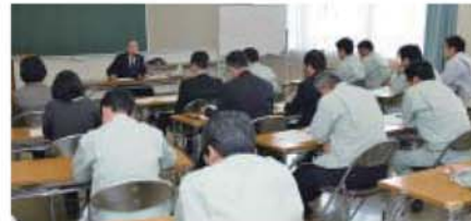
建設関係技術者職員を対象に1月24日、市保健センターで行われた研修。これからの建設技術者のあり方を学んだ