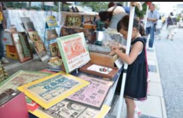
めずらしい昭和雑貨が並ぶ露店