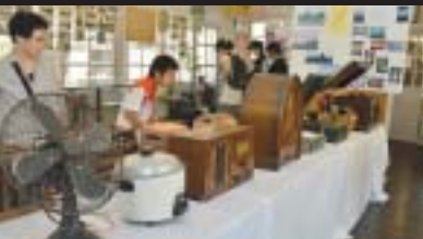
懐かしい昭和の家電