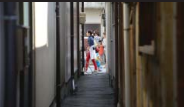
路地から人の往来を見る 着物姿でマップを配るおもてなし隊