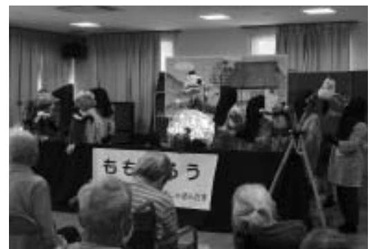
9月18日に三清荘で「ももたろう」の公演をした

私 たちは、女性が何か社会に貢献できればと思い、人形劇の公演活動をしている20人のおおちゃんグループ「人形劇団しゃぼんだま」です。毎年一つ昔話を決め、その物語を参考にオリジナルの台本を作ります。並行して壁面の大きな絵や人形、道具類の全てを、みんなで知恵を出し合いながらコツコツと手作りしています。人形劇は、幼稚園や保