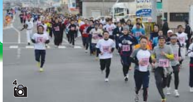
市街地中心部の幹線道を疾走！