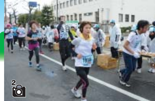
たくさんのボランティアに支えられる