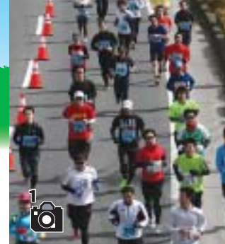
色とりどりのランナー