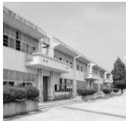
児童数の増加に伴う教室不足を解消するため、常設教室と必要備品を購入する総社東小学校

5月の臨時市議会における清音神在本線の変更契約締結に関する市長への問責決議を受けて、市長と副市長の給料月額を減額する条例を制定。ま